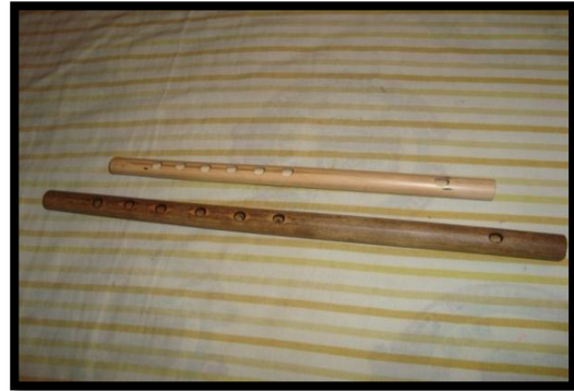
FOTOGRAFÍA 6.2 FLAUTA