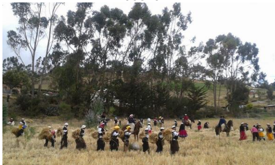
FOTOGRAFÍA N ° 14 LA COSECHA

Para realizar esta fiesta de agradecimiento, los trabajos lo ejecutan conjuntamente, en grupos o mingas donde practican la solidaridad y la reciprocidad, durante el tiempo de cosecha se brinda comida y bebida para los segadores.