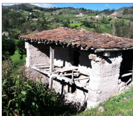
FOTOGRAFÍA N° 15 LA VIVIENDA ANTIGUA Y ACTUAL

En la actualidad los habitantes de la comunidad de Quilloac se han dejado influir por los medios económicos, y apariencias de las construcciones de las casa están en una competencia con la modernización y la utilización de mejores materiales, para nuestros taytas esto es preocupante porque ellos sienten que estas casas ya no son saludables y cálidas como las casas de adobe o bareque es más, para ellos cuando el sol de oculta, es como estar en una refrigeradora, ni siquiera pueden apegar la espalda en las paredes porque les causa dolor de articulaciones. Las casas de nuestros Taytas están abandonadas.