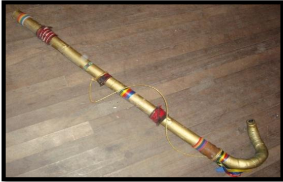
FOTOGRAFÍA 6.1 LA BOSINA