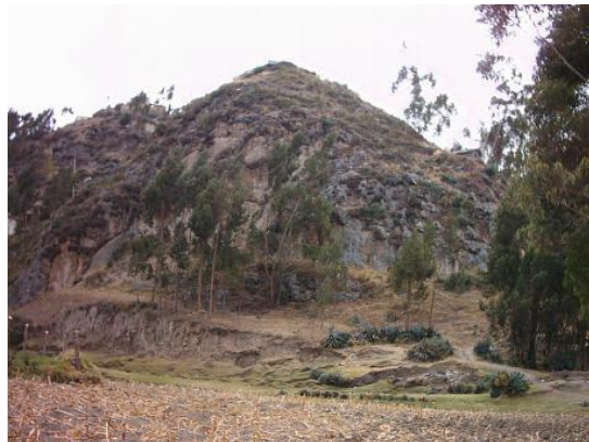
FOTOGRAFÍA N° 2 COMUNIDAD DE QUILLOAC, SECTOR AYALOMA

Bibliografías: Historia y Estatutos De Quilloac Responsable: las autoras