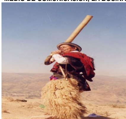
FOTOGRAFÍA N° 8 MEDIO DE COMUNICACIÓN, LA BOSINA

Fuente: la Bocina Realizado por: Rusbel Falcon.