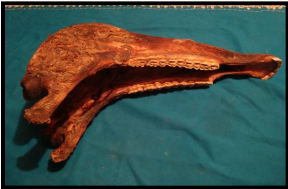
FOTOGRAFÍA 6.3 JASHA