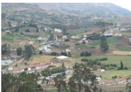
FOTOGRAFÍA N ° 1 COMUNIDAD DE QUILLOAC

Bibliografías: Historia y Estatutos De Quilloac Responsable: las autoras