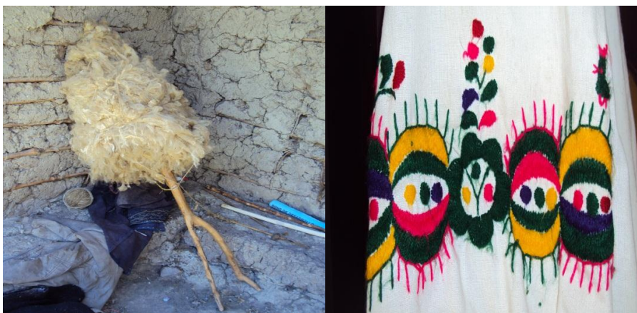
FOTOGRAFÍA N° 5 LA ARTESANÍA DE LA COMUNIDAD DE QUILLOAC

Fuente: Artesanía de la Comunidad de Quilloac: hilado y bordado Realizado: Lino Pichisaca