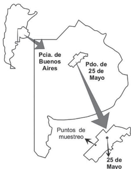
Figura 1. Provincia de Buenos Aires con el Partido de 25 de Mayo, indicando el sitio donde se realizaron las experiencias « in situ ».

tro de una subregión de la cuenca del río, caracterizada por un uso del suelo principalmente agrícola y en menor medida ganadero. En esta zona, el suelo está bien dotado de materia orgánica, con un régimen de humedad ideal para el cultivo (Hapludol típico según Soil Taxonomy, 1975) y la precipitación media anual es de 918,5 mm (1911- 2004).