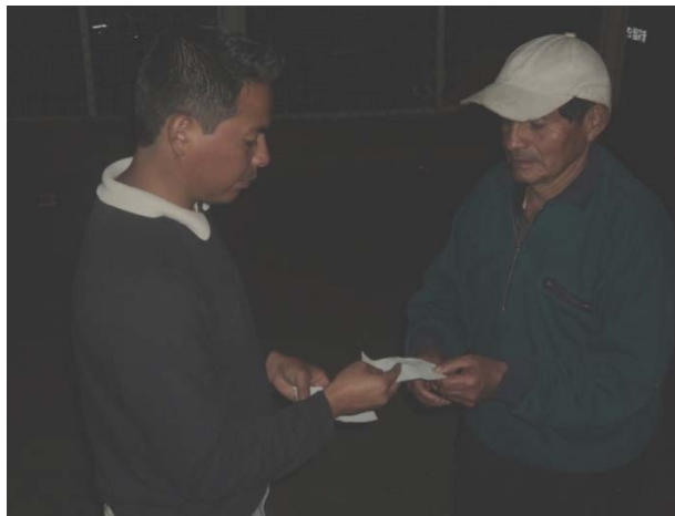
Entrega de los papeles con la música de los gres del norte