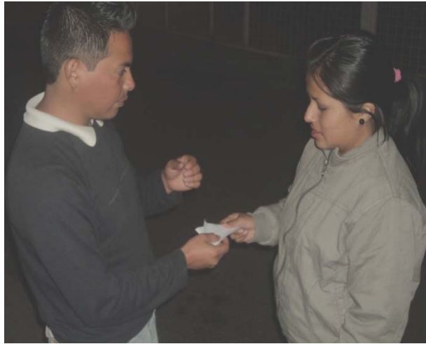
Entrega de los papeles con la música de los gres del norte