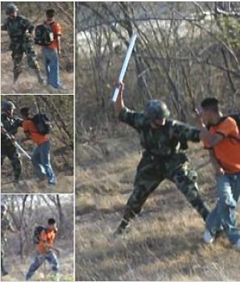
15 cadáveres en una carretera en Tamaulipas por parte del grupo z

La producción de asesinatos en serie, en la frontera México-USA han sido asesinados 280 mujeres en diez años. Se concentra en una zona geográfica determinada, la frontera México-EEUU fundamental y de gran importancia en el mundo, y el hecho de cruzar una frontera.