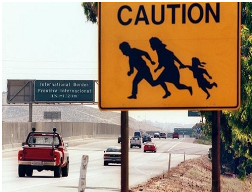
Cruzar la frontera México – EU como atracción turística 15 sep. 2006