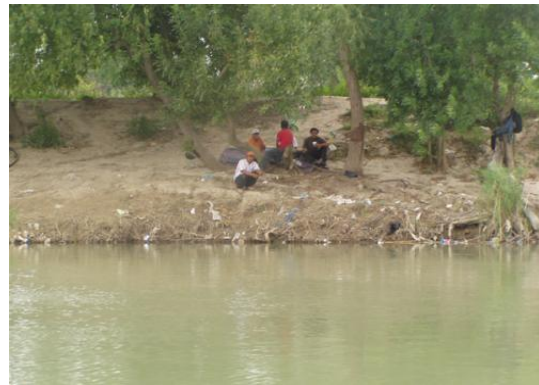
Migrantes en Tamaulipas, 27 Ago. 2010

Los inmigrantes son y han sido el sostén económico de Estados Unidos. A principio de la época republicana y para hacer a este país una potencia económica se usó la mano de obra de los esclavos y por más de 500 años la mano de obra fue gratis. Este apogeo económico y cuantiosas ganancias sin hacer ningún pago permitieron que los Estados Unidos se enriquecieran y que la gran mayoría de la riqueza que los europeos robaron del continente Americano y del continente Africano pase a las manos de los capitalistas en nuestro país. Con la abolición de la esclavitud, la fuente de mano de obra gratis fue y son ahora los inmigrantes.