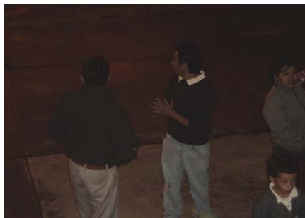
Invitación ala gente a que participe de la obra