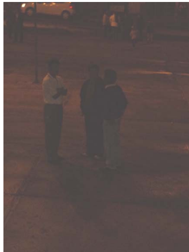
Invitación ala gente a que participe de la obra