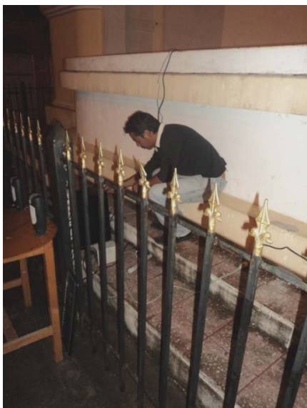
Conexión de los equipos