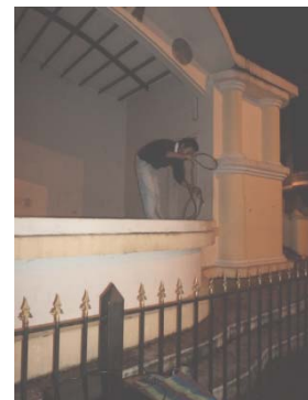
Conexión de la luz