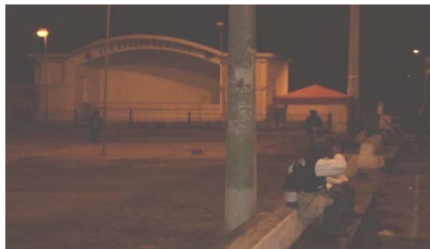
Concha acústica del parque Checa