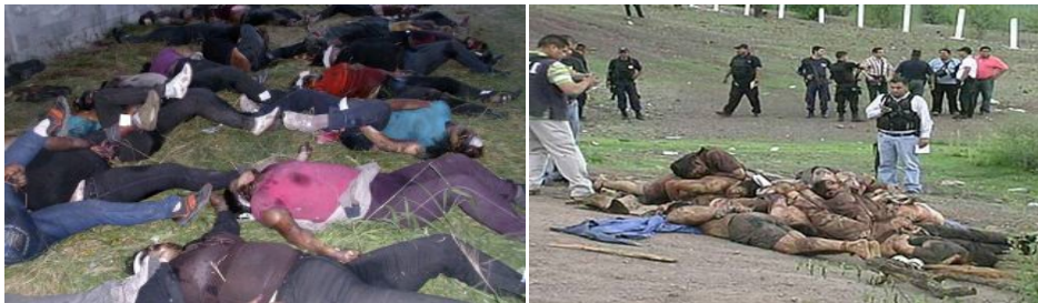
72 migrantes muertos en Tamaulipas, 26 de agosto de 2010