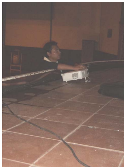
Ajustando la imagen del proyector en la pared