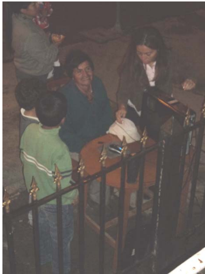
Participación del público jugando el video juego