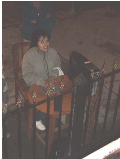
Participación del público jugando el video juego