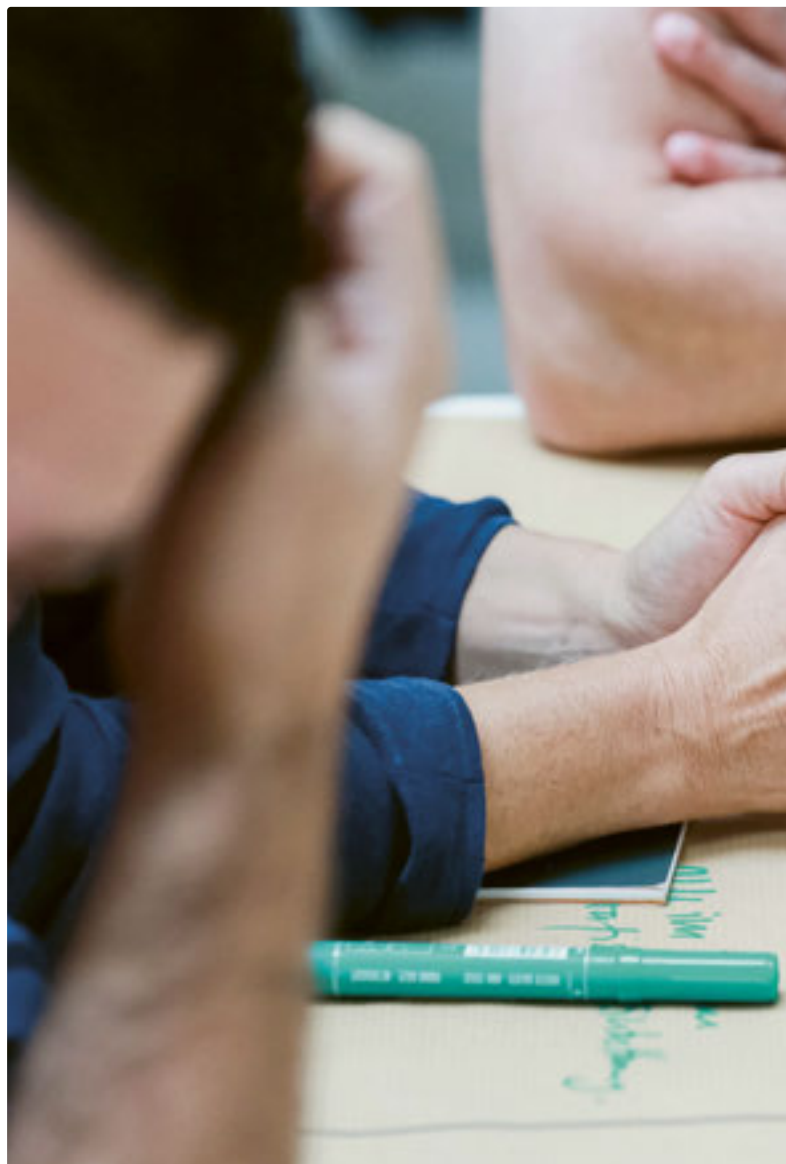
Gemeinsam wird ein Leitfaden skizziert und erarbeitet.

Um partizipative Projekte oder Prozesse zu fördern, hat das BSV die BFH beauftragt, auf der Grundlage der Studie zu den Modellen der Partizipation einen Praxisleitfaden zu erstellen. Zielgruppe des Leitfadens sind Fachpersonen, Verwaltungsmitarbeitende und engagierte Betroffene, die selbst partizipative Projekte oder Prozesse in die Wege leiten oder daran teilnehmen. Er soll als Orientierungshilfe bei der Auswahl von angemessenen Beteiligungsformen und der Gestaltung von partizipativen Prozessen dienen. Im Sinne eines Werkstattberichts gibt das BFH-Team hiermit Einblick in die Erarbeitung des Praxisleitfadens. Zudem kommen Armutsbetroffene zu Wort, die an der Erarbeitung beteiligt waren.