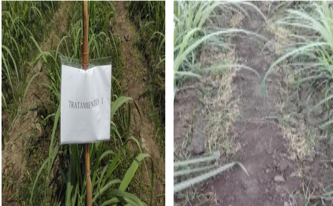
Fig. 01 control de malezas T 1

Anexo 01: Evaluaciones de los tratamientos a los 10 días de la aplicación