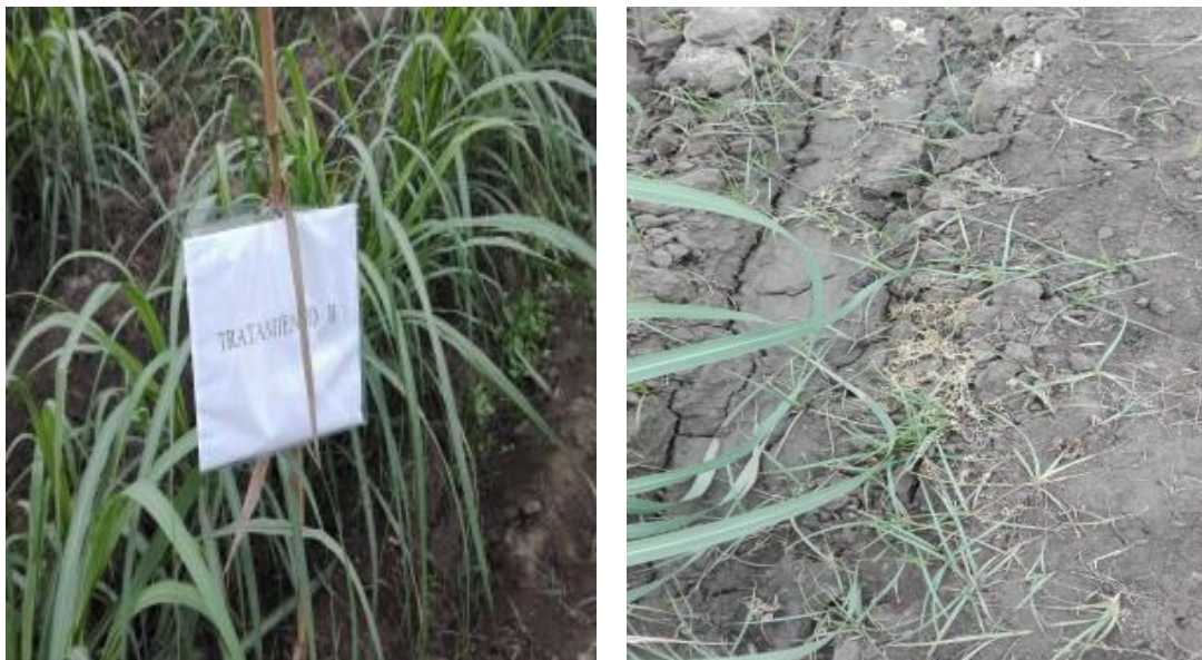
Fig. 02 Control de malezas T 2