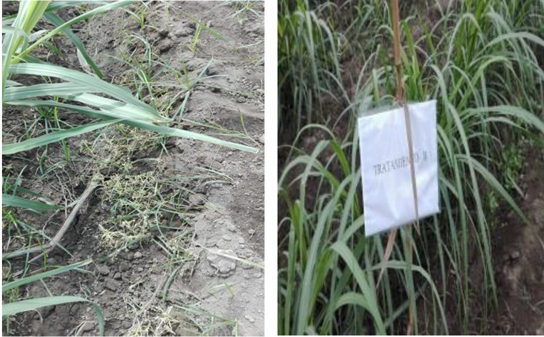
Fig. 03 Control de malezas T 3