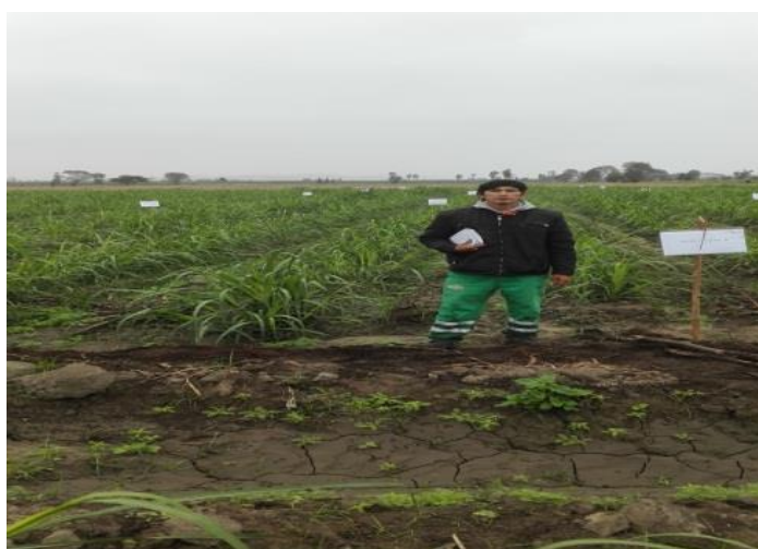
Figura 01: Ubicación del área experimental

En Manejo del Cultivo, se realizó la preparación de mezclas y dosis, se necesitó dos ingredientes activos: la ametrina y el 2,4-D que habitualmente se recomienda para el control de malezas de hoja ancha, se consideró las siguientes dosis: Tratamiento 1; 2 l de ametrina y 1,50 l de 2,4-D; Tratamiento 2; 2,50 l de ametrina y 2 l de 2,4-D; Tratamiento 3; 3 l de ametrina y 2,50 l de 2,4-D. Las dosis mencionadas son para una hectárea (un cilindro). La preparación de la mezcla se realizó específicamente para el área de cada tratamiento ( 67,50 \text{ m}^2 \times 3 = 202,50 \text{ m}^2 ). Tratamiento 1; Ametrina: 0,40 ml y 2,4-D: 0,30 ml; Tratamiento 2: Ametrina: 0,50 ml y 2,4-D: 0,40 ml; Tratamiento 3: Ametrina: 0,60 ml y 2,4-D: 0,50 ml para todos los tratamientos la dilución se efectuó en 4,05 l de agua.