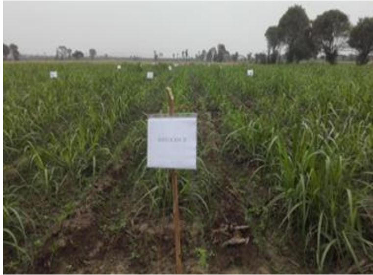
Figura 02: ubicación de tratamientos

En la Preparación del terreno, consideraremos el inicio de este trabajo experimental desde el segundo corte de la campaña realizado el 01/06/2017, esta labor se inicia haciendo uso de fuerza mecánica (usando tractor) que realizó el despaje (sacar la broza o paja de la cosecha anterior con el implemento de arrastre) esta labor se efectuó luego de una semana del corte anterior. Luego del despaje, se procede a la quema de broza. Posteriormente se efectúa reacondicionamiento del terreno con la finalidad de romper la capa del suelo que se encuentra compactado por la cosecha anterior y de ese modo darle las mejores condiciones de oxigenación a la raíz. A continuación, con el tractor se reforma las acequias y las tomas de agua para iniciar el riego (en este caso el remojo).