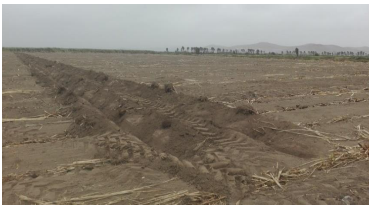
Figura 03 reformación de los bordos

En la Preparación del terreno, consideraremos el inicio de este trabajo experimental desde el segundo corte de la campaña realizado el 01/06/2017, esta labor se inicia haciendo uso de fuerza mecánica (usando tractor) que realizó el despaje (sacar la broza o paja de la cosecha anterior con el implemento de arrastre) esta labor se efectuó luego de una semana del corte anterior. Luego del despaje, se procede a la quema de broza. Posteriormente se efectúa reacondicionamiento del terreno con la finalidad de romper la capa del suelo que se encuentra compactado por la cosecha anterior y de ese modo darle las mejores condiciones de oxigenación a la raíz. A continuación, con el tractor se reforma las acequias y las tomas de agua para iniciar el riego (en este caso el remojo).