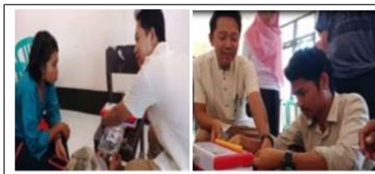
Gambar 5. Pelatihan Pengemasan Ikan Asap dengan Vacum Sealer

Kegiatan pelatihan makanan bersih, enak dan sehat dilaksanakan pada tanggal 11 Juli 2020. Kegiatan ini diikuti oleh 30 orang peserta masyarakat Desa Sepakek. Materi yang diberikan dalam pelatihan ini yaitu mengenai cara pengemasan makanan yang enak, bersih dan sehat. Masyarakat Desa Sepakek yang nantinya menjadi tuan rumah di Wisata Jurang Sate perlu selalu mengutamakan kebersihan dalam menjual makanan. Pengemasan yang baik dan menarik perlu diperhatikan juga untuk menjaga makanan tetap aman dikonsumsi oleh pengunjung dan menambah daya jual makanan. Setelah materi diberikan, peserta pelatihan juga diberi praktek cara pengemasan ikan asap yang telah dibuat pada pelatihan sebelumnya. Pengemasan ikan tawar asap dilakukan dengan menggunakan mesin vacuum sealer agar ikan asap dapat tetap sehat dan bersih untuk dipasarkan kepada pengunjung wisata Jurang Sate serta dapat bertahan lebih lama.