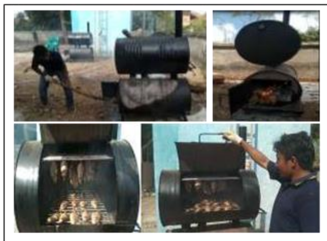
Gambar 4. Proses Pengasapan Ikan Air Tawar

Kegiatan pelatihan dan pendampingan Pengasapan ikan air tawar (PETA) kepada masyarakat Desa Sepakek dilaksanakan pada tanggal 9-10 Juli 2020. Dalam kegiatan ini mitra atau peserta pelatihan diajak untuk mempraktekkan cara melakukan pengasapan ikan air tawar mulai dari proses pemilihan ikan air tawar yang baik, membersihkan ikan, memberi bumbu, perendaman bumbu, penirisan ikan, pengapian hingga pengasapan dengan menggunakan alat pengasapan ikan air tawar (PETA).