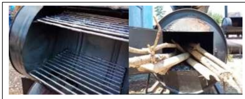
Gambar 2. Bagian Atas (Rak Ikan) dan Bagian Bawah (Pengapian) Alat Pengasapan Ikan

(PETA) ini selanjutnya digunakan untuk melakukan pengasapan terhadap ikan tawar yang dihasilkan oleh masyarakat Desa Sepakek.