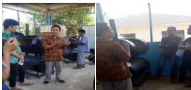
Gambar 3. Pelatihan Pengenalan Peralatan Pengasapan Ikan Air Tawar (PETA)

masyarakat Desa Sepakek, terdiri dari anggota karang taruna “Duta Taruna”, anggota Bumdes “Sahara Jaya”, dan perwakilan masyarakat Desa Sepakek.