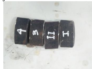
Gambar 2.1 Pemotongan material menjadi beberapa bagian