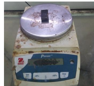
Gambar 2.2 Penimbangan Material