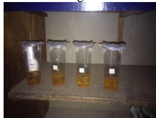
Gambar 2.5 peletakan material yang akan diuji di ruangan tertentu