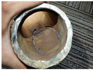
Gambar 1.2 elbow bagian dalam