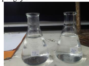
Gambar 2.3 Persiapan fluida untuk pengujian