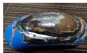
Gambar 1.1 elbow bagian luar

Berikut merupakan foto salah satu fitting yang mengalami kebocoran.