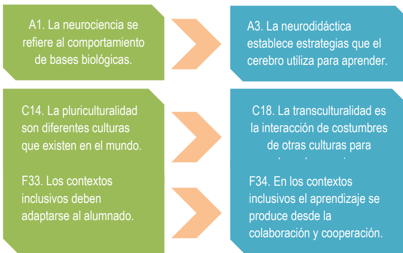
Correlaciones de la escala de Máster: