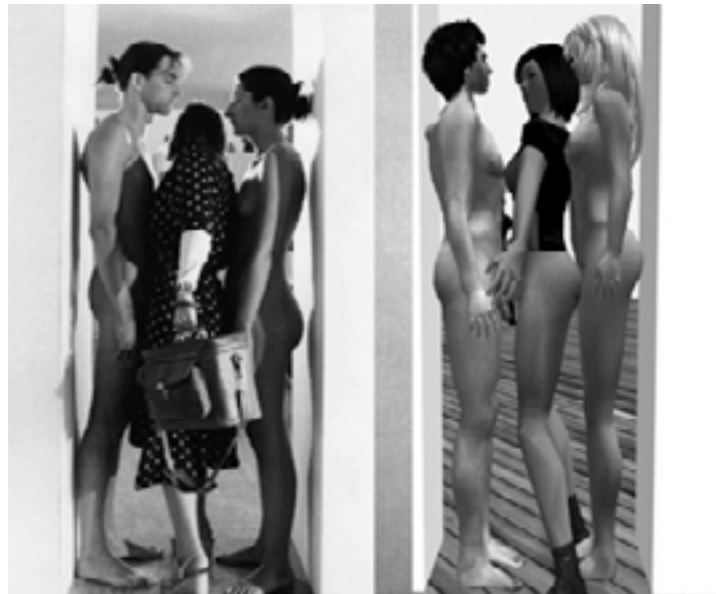
Fig. 2: Comparación de la obra Imponderabilia de M. Abramovic en la realidad y en la virtualidad.

http://www.reakt.org/imponderabilia/ y figura 2) – Marina y Ulay xv se colocan desnudos en la entrada de la sala, forzando a los visitantes a participar de la performance eligiendo como entrar- en el año 2007, cuando los avatares de Eva and Franco Mattes reprodujeron su obra real del año 1970 - en comparación con la artista virtual Gazira Babeli.