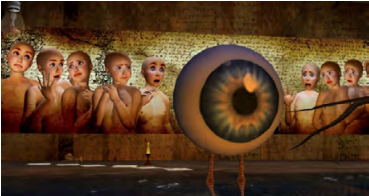
Ilustración 5: The Kiss de Rose Borchovsky (2010).

ir encontrando artistas virtuales que se corresponden con estos grupos reales más específicos. Es el caso, por ejemplo, de los que exploran el arte del cuerpo en el mundo real, con avatares artistas que también lo hacen como Rose Borchovsky, que investiga y juega con su cuerpo virtual dentro del metaverso (véase figura 5). Juega con su avatar y crea distintas instalaciones y fotografías. Expone lo que tiene de humano y de ser virtual (avatar).