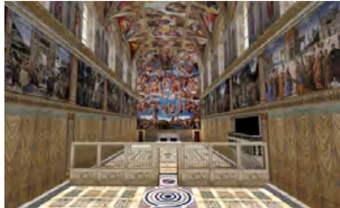
Fig. 1: Plano general de la Capilla Sixtina en S. L.

• Aquellos que piensan que S.L es un lugar ideal para las performances y el teatro tienen su correlato en aquellos artistas creadores de performances en el mundo real.