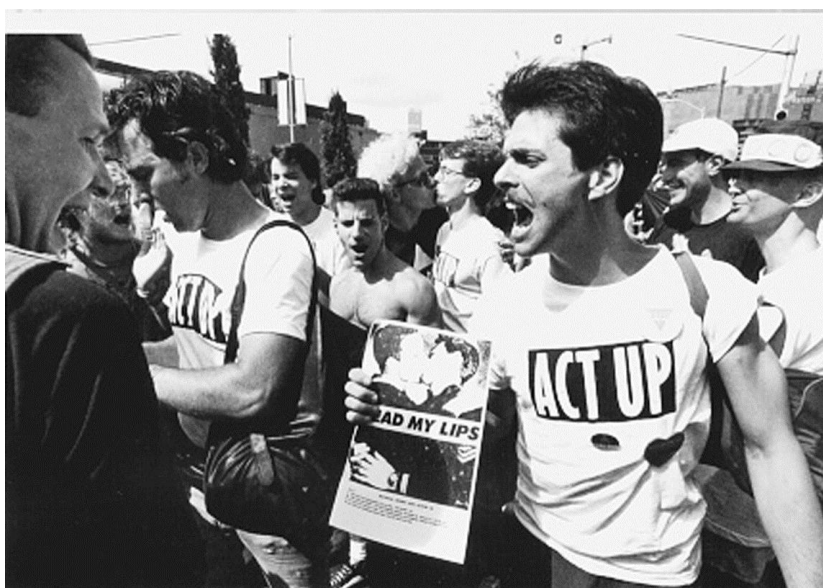
Imagen 5. Act up, Manifestación, New York, (1987). http://www.aidsactionnow.org/?p=309

El Sida ha modificado nuestra percepción de la salud, del sexo, de nuestra corporeidad, de las relaciones humanas y, en definitiva, de nuestras vidas. Pero la fuerza de las propuestas artísticas, que han surgido para dar respuesta a la pandemia, es uno de los aspectos más importantes que habrá que conservar en la memoria, pues este posicionamiento ha sido uno de los aspectos más significativos de la historia de la crisis del Sida, ya que planteó que la crisis sanitaria era en realidad una crisis política, con su consecuente régimen de representación visual, que por cierto, aún no ha concluido ((Larrazabal, I. 2011).