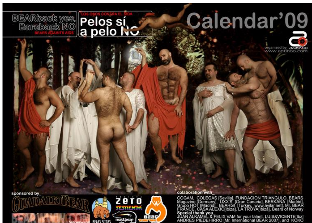
Imagen 1. Campaña Pelos sí, a pelo no , Osos contra el Sida (2009).

Lo cierto es que mientras se centraban en construir este estereotipo, olvidaron hablar de prácticas sexuales concretas y del riesgo que conlleva no disfrutarlas con prevención. Muestra de ello podrían servirnos las campañas del 2003 y 2010. Si en una el lema es: A todos nos puede llegar el virus del sida ( www.msssi.gob.es/ciudadanos/enfLesiones/enfTransmisibles/sida/docs/CARTEL_VIRUS.pdf ), omitiendo cualquier alusión a las vías de contagio y la ausencia de prevención, en la siguiente el mensaje es más esperanzador, Ponte una medalla ( www.ponteunamedalla.es ). Pero de la imagen estereotipada de esta campaña, un torso juvenil anónimo, presentada a modo de síntesis de diversas realidades, prácticas e identidades, son tantas las preguntas que se desprenden, que más que conseguir una información eficaz, obtenemos una evidencia de falta de precisión en el mensaje, en el destinatario e, incluso, en la recomendación que se intenta transmitir. No hay buenas y malas prácticas de riesgo, sino con y sin protección. La clave parece simple, pero se termina por proponer una desinformación contraproducente, al no especificar y detenerse en aspectos concretos, que se siguen dejando a merced de las asociaciones implicadas en esta pandemia.