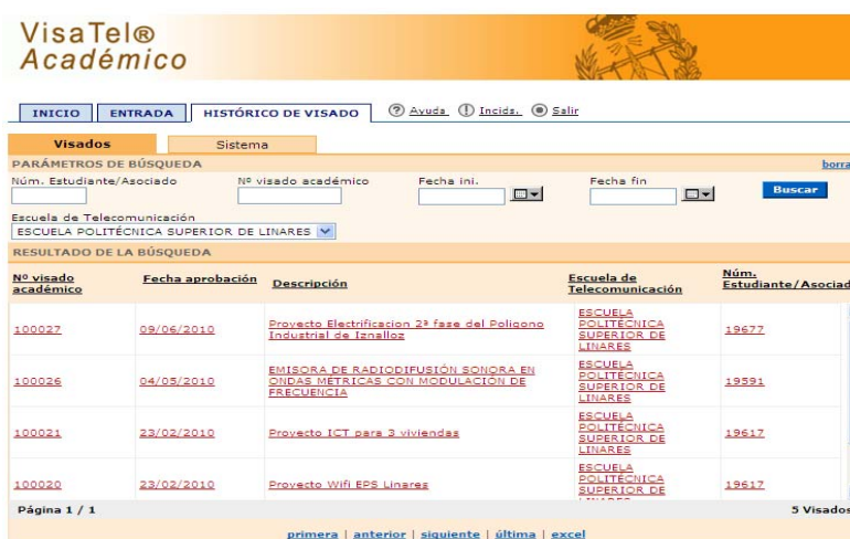
Figura 5. Histórico de proyectos visados en la EPS de Linares.

Una vez visados, se tienen disponibles todos los proyectos visados en la parte de Histórico de Visados, donde se pueden filtrar por diferentes parámetros.