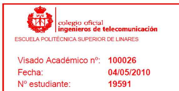
Figura 4. Sello del visado académico.

Una vez visados, se tienen disponibles todos los proyectos visados en la parte de Histórico de Visados, donde se pueden filtrar por diferentes parámetros.