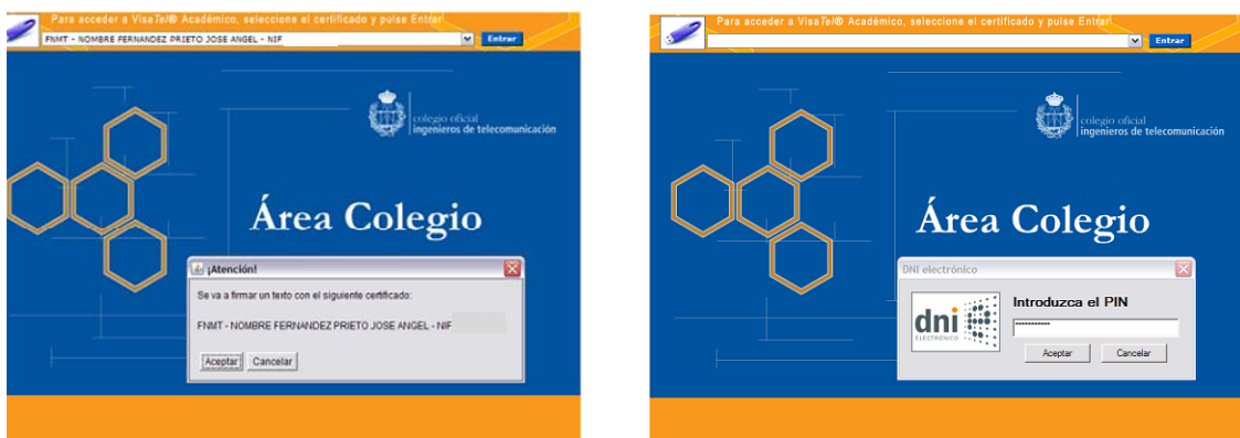
Figura 1. Acceso a la plataforma mediante certificado de la FNMT o DNIe.

La plataforma es de fácil manejo e intuitiva. El acceso a la misma para los estudiantes se realiza a través de la URL http://visatelacademico.coit.es/estudiantes . La plataforma muestra información gráfica del estado de todos los trabajos permitiendo una configuración personal. Además, existe un procedimiento de Anexar Documentos guiado, un buscador cruzado con múltiples parámetros en el histórico de visados y permite la gestión de incidencias en los trabajos con integración del correo electrónico. Para acceder el alumno puede utilizar el certificado digital incluido en el DNIe o bien uno expedido por la Fabrica Nacional de Moneda y Timbre. Ambos procedimientos han sido probados de forma satisfactoria.