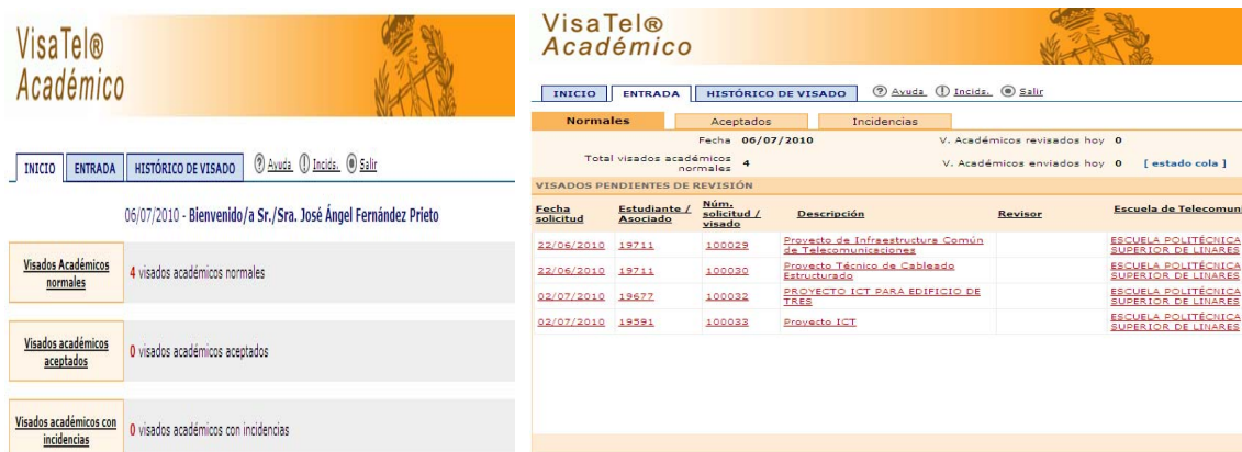
Figura 2. Interfaz para la revisión de los proyectos técnicos.

La primera revisión de los proyectos se ha realizado en la propia Escuela Politécnica de Linares por los profesores que participan en el proyecto de innovación. Los revisores acceden a través de: http://visatelacademico.coit.es/academico e indican las incidencias relacionadas de acuerdo con los criterios de elaboración de proyectos y normativas existentes. Cuando los alumnos envían los proyectos, el profesor revisor los ve en una cola de entrada (Visados Académicos Normales), ordenados por fecha, nº de asociado y el título.