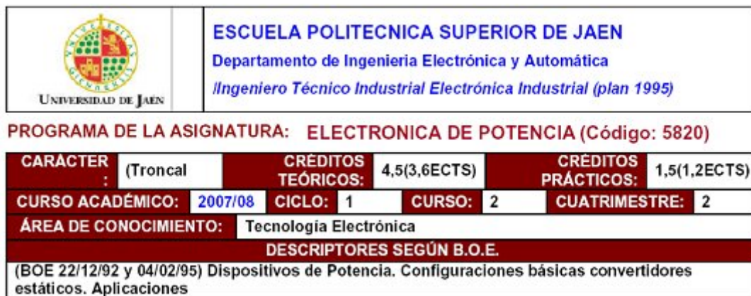
Figura 2. Datos básicos relativos a la asignatura Electrónica de Potencia.

Con todo ello, se aporta al alumnado los principios básicos necesarios para, analizar, diseñar, y aplicar los convertidores basados en semiconductores de potencia.