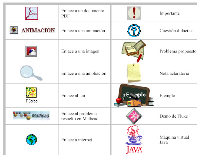
Figura 5. Simbología empleada en el trabajo

Los diferentes símbolos empleados a lo largo del trabajo hemos procurado que sean uniformes, claros, sencillos y adaptados a cada elemento a los que se refiere. Se presentan en el la figura 5 .