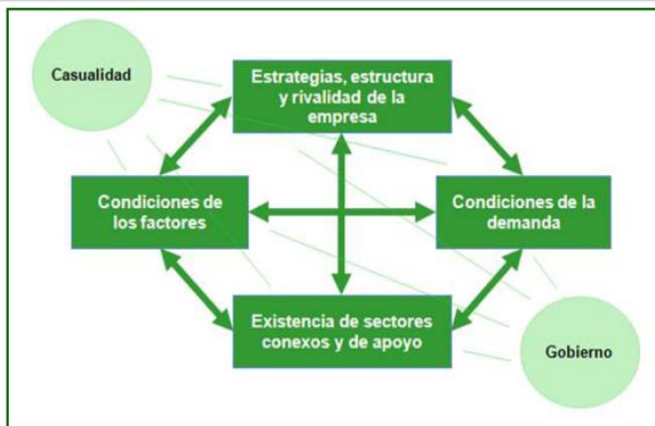
GRÁFICO 2: DIAMANTE DE COMPETITIVIDAD