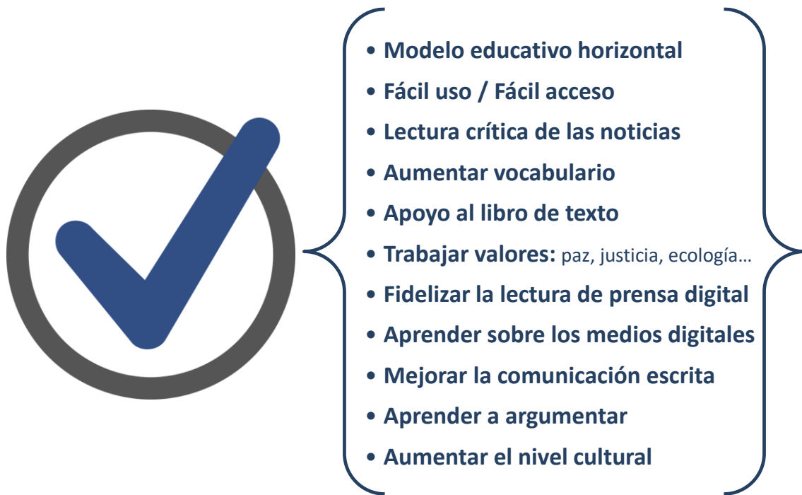
Figura 1: Ventajas del uso de la prensa digital en la educación.

Igualmente, existen desventajas y riesgos. Así pues, las actividades o proyectos educativos con la prensa digital requieren de equipos informáticos y del acceso y manejo de las herramientas adecuadas: ordenadores, conexión a Internet y navegadores. Si se trata de poner en marcha una publicación escolar en la Red, también es necesario disponer y tener conocimiento de editores de imágenes, procesadores de texto, y programas o gestores de contenidos para el diseño de la web y el mantenimiento de la página: WordPress, Blogger, Edublogs, etc. Otro requisito es la formación específica del profesorado, porque con esta alfabetización: mediática, tecnológica y social, aprenderá a aplicar las