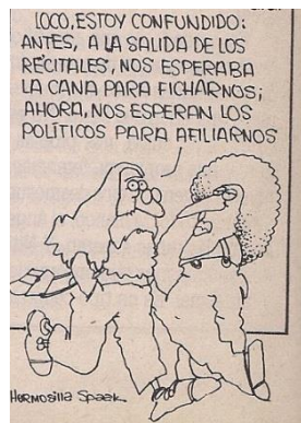
Viñeta de Hermosilla Spaak.(26)

En el número siguiente, la representación gráfica volvió desde el recurso del humor gráfico a proponer una posible síntesis al respecto. Una viñeta de Hermosilla Spaak destacaba el posible cambio de perspectiva, de las razzias policíacas correlativas en dictadura a los recitales, a la eclosión opositora.