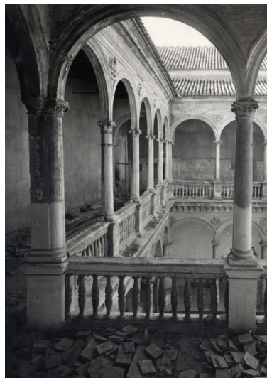
Ilustración 10. GRANADA. Hospital Real. Patio de la Capilla. Galería superior (1963).