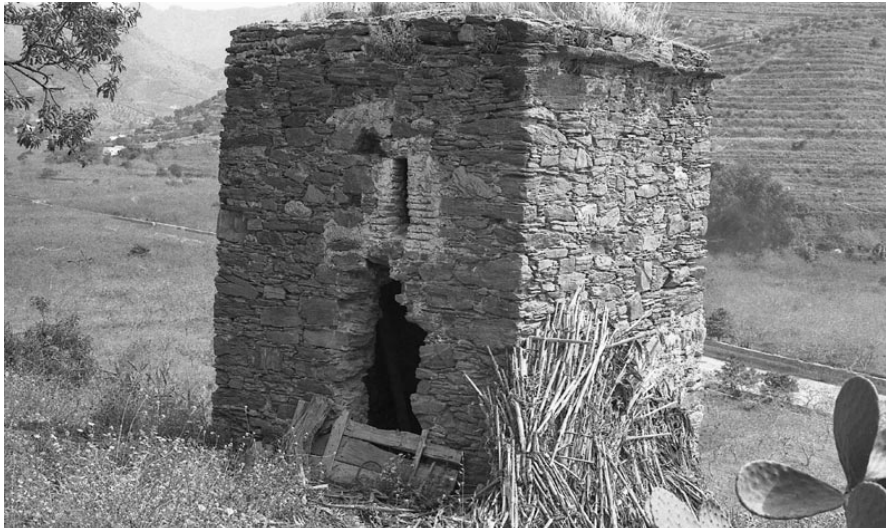
Ilustración 2. ALMUÑECAR. Columbario romano. Frente Oeste. Estado previo a la intervención (ca.1975).