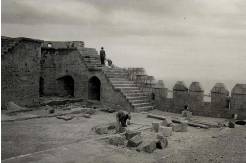
Ilustración 6. ALMERÍA. Alcazaba. Tercer Recinto durante las obras de restauración (1942).

En esta exposición acerca de los principales parámetros que conforman su trabajo como especialista en restauración arquitectónica hacemos hincapié en que la Guerra Civil, unos años en los que comienza su andadura como arquitecto restaurador y, sobre todo la postguerra, fue un periodo que sirvió de inmejorable ensayo para su formación como profesional de este campo. Y es que la cantidad y extensión de los monumentos puestos bajo su tutela fue realmente ingente, lo que resultó esencial en su aprendizaje y en su bagaje cultural. Al respecto, debemos incluir una aclaración fundamental: la necesidad de discernir entre sus actuaciones por encargo de la Dirección General de Regiones Devastadas, en las que se acometen reconstrucciones con un fuerte carácter simbólico, y aquellos otros trabajos para la Dirección General de Bellas Artes –como Arquitecto de Zona- que, en ocasiones, presentan similares criterios de intervención pero que, en otros muchos casos, prevalecen las labores de mera conservación y mantenimiento. [Ilustración 7]