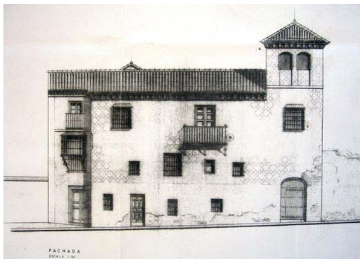
Ilustración 4. GRANADA. Casa nº 19 de la calle de Santa Isabel la Real. Fachada (alzado) Estado previo a la intervención (1971).