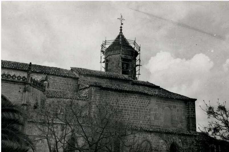
Ilustración 9. ÚBEDA. Iglesia de San Pablo. Vista de la torre durante los trabajos de restauración (ca. 1942).

almeriense. O su labor restauradora en la Alcazaba de Málaga entre 1941-1968, con más de una decena de memorias de intervención de las que se desprende una fuerte dependencia con respecto al modelo estético y arquitectónico de la Alhambra, incluso en el diseño de los jardines, como ocurre en los Cuartos de Granada. A diferencia de la Alcazaba de Almería en donde prevalecen, con algunas excepciones, las excavaciones arqueológicas y las obras de consolidación para destacar la austeridad militar del recinto. No podemos olvidar que interviene en la práctica totalidad de las iglesias del Albayzín, cuyo magnífico repertorio de cubiertas mudéjares será objeto de especial tratamiento por parte del arquitecto. Y que, desde mediados de los años cincuenta, comienza su campaña de actuación sobre las murallas árabes del Albaicín, cuyos lienzos presentaban por esas fechas un deplorable estado de conservación. Así como su relevante aportación, ya desde la inmediata postguerra, a la conservación de la riqueza monumental de Úbeda y Baeza. En definitiva, un recorrido visual por el patrimonio monumental del sureste peninsular que nos muestra lo relevante de su labor reconstructora de posguerra, entre otros muchos aspectos. [Ilustración 9][Ilustración 10]