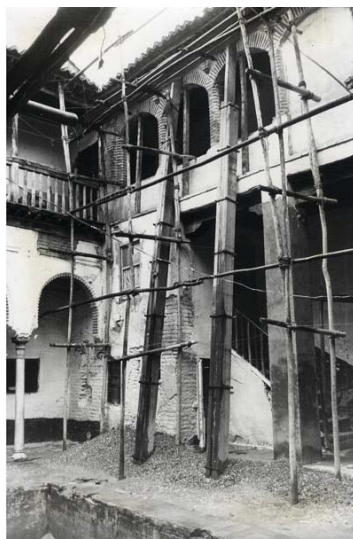
Ilustración 7. GRANADA. Casa morisca en calle Horno del Oro nº 14. Ángulo suroeste del patio (1970).

En esta exposición acerca de los principales parámetros que conforman su trabajo como especialista en restauración arquitectónica hacemos hincapié en que la Guerra Civil, unos años en los que comienza su andadura como arquitecto restaurador y, sobre todo la postguerra, fue un periodo que sirvió de inmejorable ensayo para su formación como profesional de este campo. Y es que la cantidad y extensión de los monumentos puestos bajo su tutela fue realmente ingente, lo que resultó esencial en su aprendizaje y en su bagaje cultural. Al respecto, debemos incluir una aclaración fundamental: la necesidad de discernir entre sus actuaciones por encargo de la Dirección General de Regiones Devastadas, en las que se acometen reconstrucciones con un fuerte carácter simbólico, y aquellos otros trabajos para la Dirección General de Bellas Artes –como Arquitecto de Zona- que, en ocasiones, presentan similares criterios de intervención pero que, en otros muchos casos, prevalecen las labores de mera conservación y mantenimiento. [Ilustración 7]