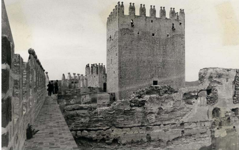
Ilustración 1. VÉLEZ-BLANCO. Castillo. Vista desde el ángulo Suroeste hacia la fachada Sur de la Torre del Homenaje (1970).