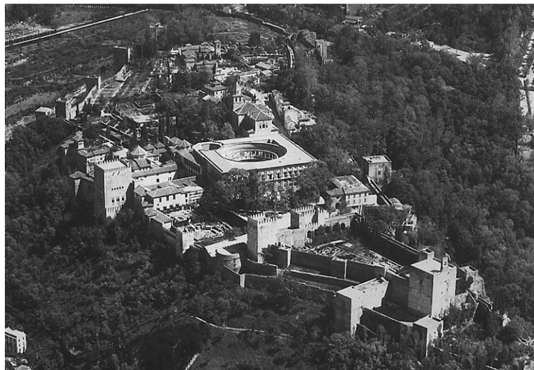
Ilustración 8. GRANADA. Vista aérea del Conjunto Monumental de la Alhambra y Generalife (s.f.).