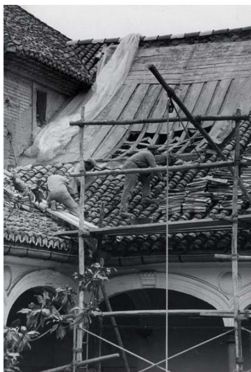
Ilustración 5. GRANADA. Convento de Santa Isabel la Real. Cubiertas del Claustro e Iglesia durante las obras. Ángulo Sureste (1976).

intervenciones poseen una finalidad estructural, y no decorativa, predominando las labores de recalce y consolidación de estructuras. [Ilustración 5]