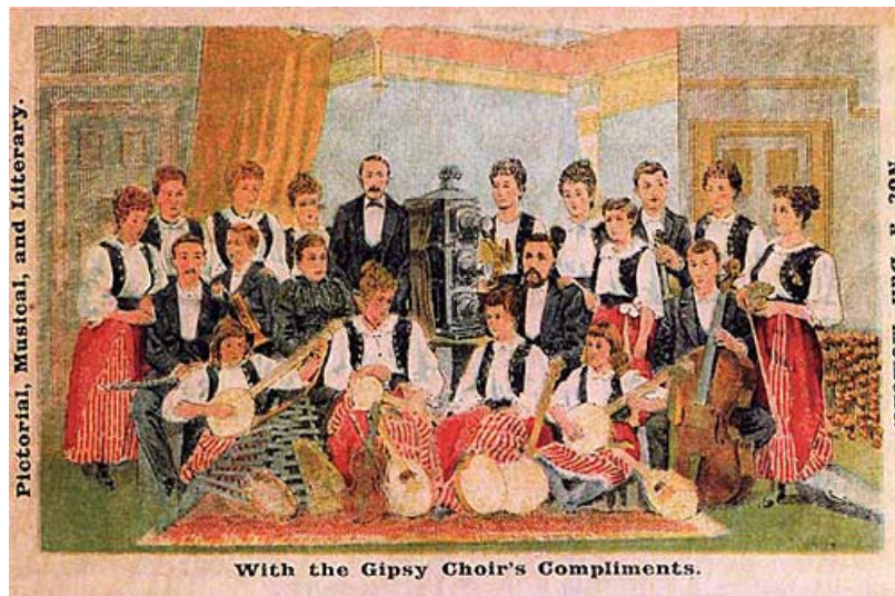
Ilustración 3. 1892. Anónimo. Dyson's Gipsy Choir.

connotaciones. Desde el punto de vista institucional, el vocablo pone de relieve su dependencia con respecto a una organización o concepto más amplio, en detrimento de la idea de organización por derecho propio. Por ejemplo, una colección de placas de linterna mágica remite a un conjunto de obras aleatoriamente formado que es propiedad de un particular o una institución, y que suele estar integrada en un fondo patrimonial. Por tanto, el término colección entendido como ese amplio espacio simbólico donde es susceptible de verse reunido cualquier patrimonio debe aplicarse de forma juiciosa y no dogmática. De hecho, hay que indicar que aunque las colecciones privadas no sean organizaciones o no se las considere como tales, si se gestionan de conformidad con la definición indicada, por ello han sido tenidas en cuenta en nuestro estudio.