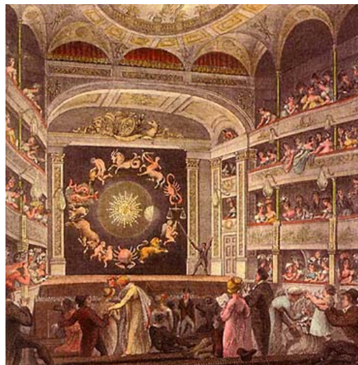
Ilustración 1. 1825. Anónimo. The Proscenium of the English Opera House in the Strand.

La historia de la linterna mágica se inició con la aplicación durante el siglo XVII de una serie de principios físicos que permitieron la proyección de imágenes. Pocas décadas después, la linterna mágica emergió como un dispositivo que se consolidó e institucionalizó como medio de comunicación en los primeros tres cuartos del siglo XIX. Tras su industrialización y comercialización en serie, acaecida en el último cuarto de dicho siglo, sobrevino la decadencia de la linterna mágica durante la primera década del siglo XX. Varias razones han dificultado un acercamiento teórico y metodológico apropiado para el estudio sistemático de las proyecciones audiovisuales mediante linterna mágica. En primera instancia, el obstáculo que supone la amplitud cronológica de su historia, que discurre durante más de tres siglos. También la controvertida