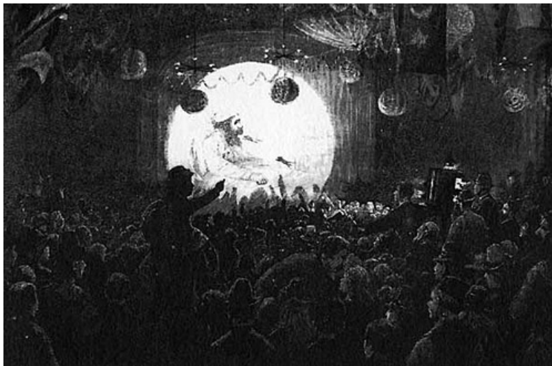
Ilustración 2. 1890. Anónimo. The Children's Evening Party.

interpretación histórica que ha ocasionado la adscripción de la linterna mágica al término 'precine' ha supuesto un freno a la hora de considerarla como un objeto relevante de estudio. Tampoco ha ayudado que sus referencias bibliográficas sean tan desiguales como fragmentarias, y que siempre aparezcan incluidas en trabajos de mayor envergadura relacionados con su contexto mediático. Asimismo ha supuesto un problema la dispersión de los repertorios patrimoniales que están relacionados con las proyecciones mediante linterna mágica, hasta el punto de provocar que los mismos hayan sido infrutilizados como fuentes de investigación. Ante tal panorama, el presente trabajo tiene un doble objetivo: Localizar dónde pueden estar salvaguardados los repertorios patrimoniales relacionados con la linterna mágica y proponer una tipología de dichos fondos. [Ilustración 2]