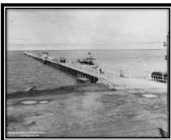
Figura 2: Major Eliezer Levy

Entretanto, muitos descendentes de Judeus abandonaram a religião judaica, e conservaram apenas o sobrenome hebraico, como foi o caso de alguns integrantes das