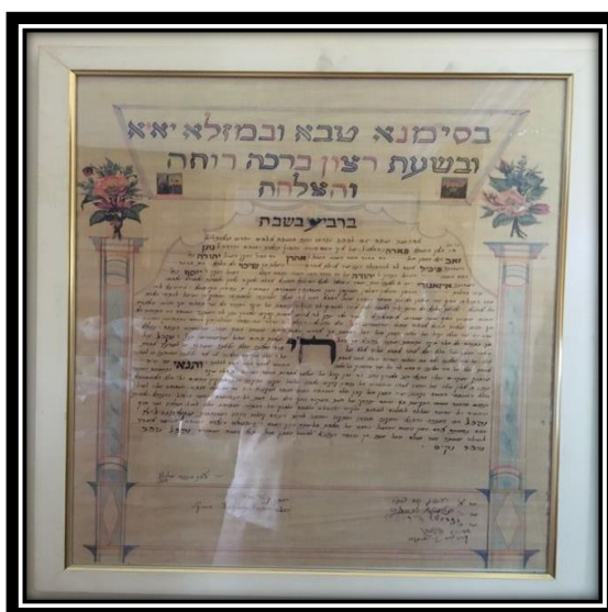
Figura 12: Ketubá-certidão de casamento