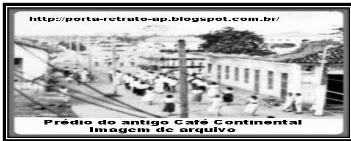
Figura 13: Prédio do Antigo Café Continental