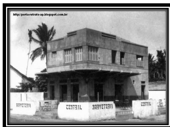
Figura 8: Sorveteria Central

A família Bemerguy foi uma das famílias de descendência judaica que também exerceram comércio na cidade de Macapá nas décadas de 1940 e 1950, Naftali Mair Bemerguy trabalhava no IBGE e juntamente com sua esposa Ester Zagury Bemerguy eram donos do armarinho Bemerguy.