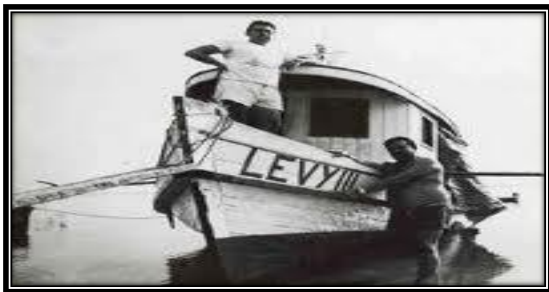
Figura 3: Regatão Levy III Fonte: nilsonmontoril.blogspot.com.br

As práticas sociais dos regateiros instituíaam todas as amplitudes da vida cotidiana, estabelecidas entre os sujeitos do período. Apesar de a atividade ser essencialmente comercial, o regatão está constituído de sentimentos, valores e costumes que demonstram a interação entre os habitantes da região amazônica (CAMBRAIA, 2008). Geralmente Judeus e sírio-libaneses dominavam estas atividades comerciais marítimas que há muito tempo era monopolizada pelos portugueses.