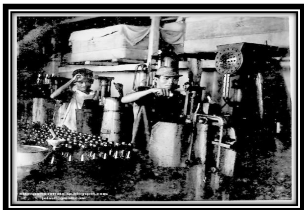
Figura 8: Fábrica Flip Guaraná