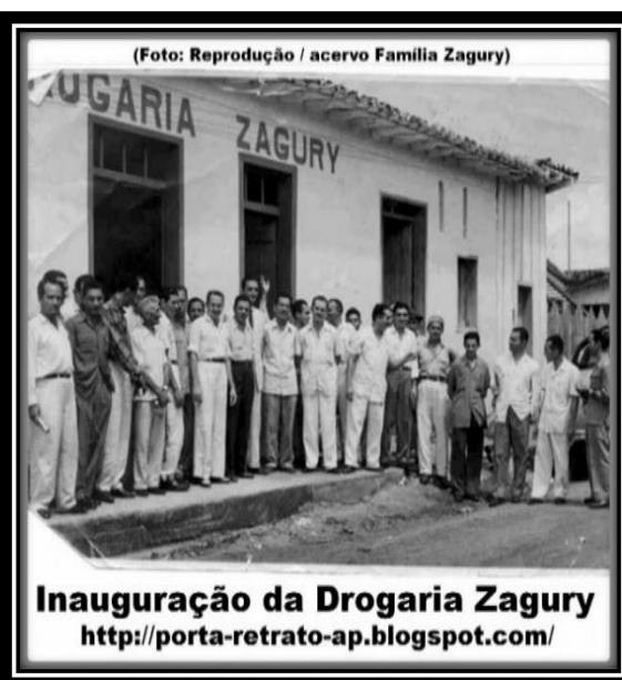
Figura.6:Inauguração da Drogaria Zagury