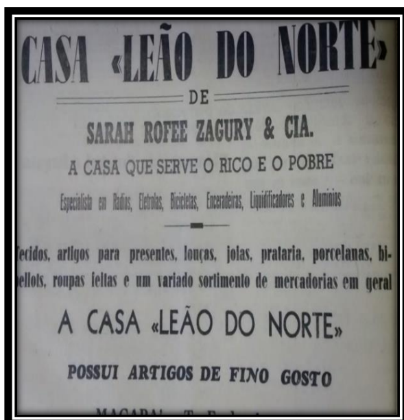
Figura5: Propaganda Casa Leão do Norte