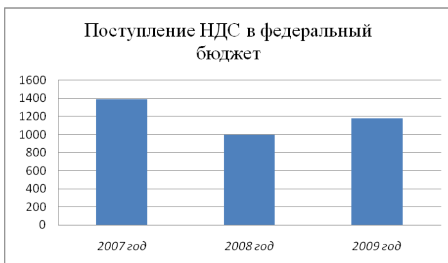
Диаграмма 1. Динамика поступлений НДС в бюджет

Анализ всех вариантов альтернативы налогу с оборота и тенденций развития налоговых систем зарубежных стран показал, что единственно правильным решением было введение налога на добавленную стоимость. Налог на добавленную стоимость занимал и занимает одно из самых важных мест в системе налогов России (см диаграмма 1). Так, в 2007 г. налог на добавленную стоимость на товары (работы, услуги), реализуемые на территории России, составил 1390,6 млрд руб. и возрос по сравнению с предыдущим годом в 1,5 раза. Поступления налога на добавленную стоимость на товары (работы, услуги), реализуемые на территории Российской Федерации, в 2008 году составили 998,4 млрд. рублей и по сравнению с 2007 годом снизились на 28,2%. В то же время в 2009 НДС было получено 1176,6. Рост поступлений объясняется переходом в 2008 году на квартальную уплату налога.