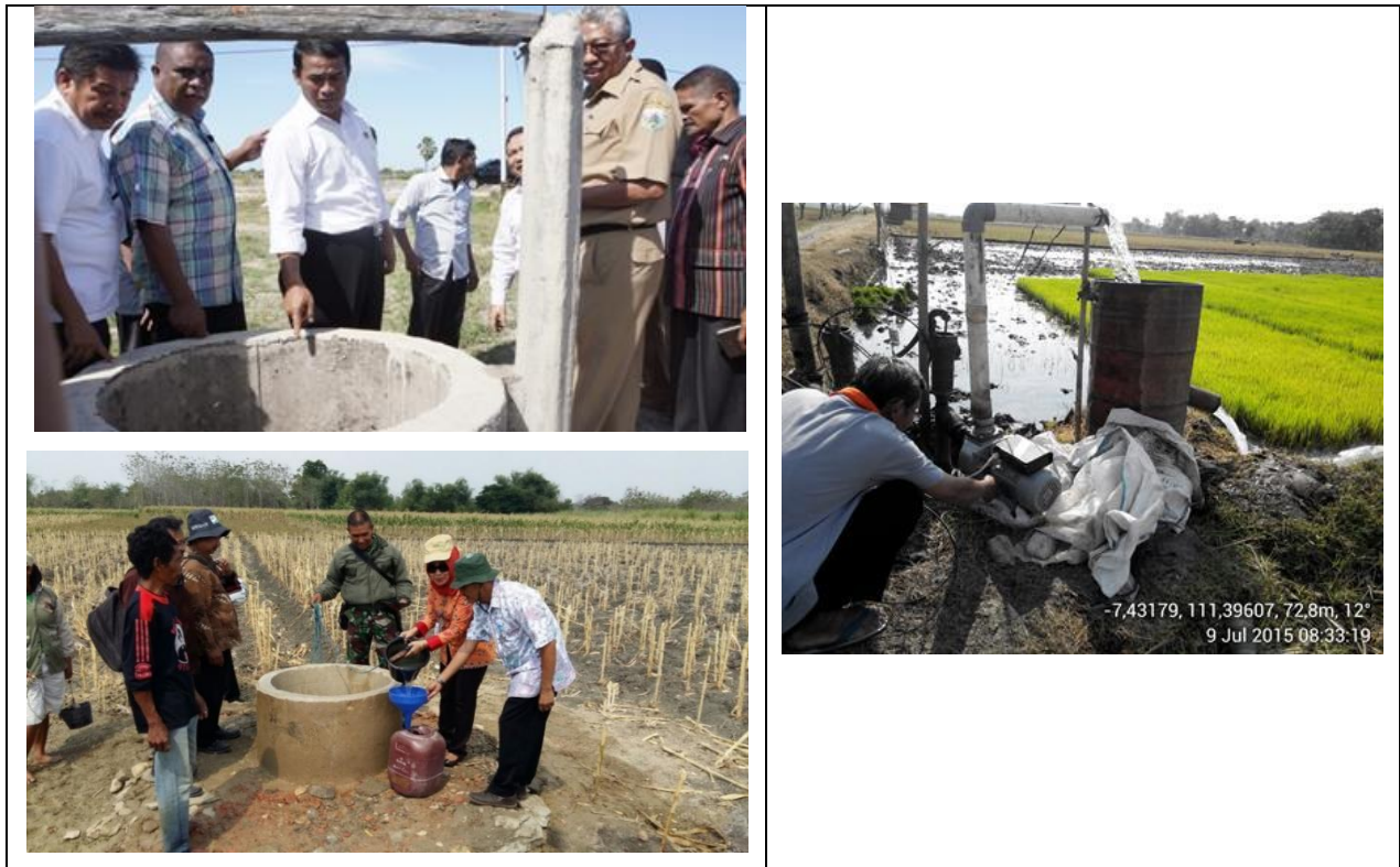
Gambar 7. Sumur air dangkal di Kabupaten Ngawi

Sumur dangkal di Kabupaten Ngawi dapat memberikan layanan irigasi pada lahan seluas 4 ha. Untuk pembangunan sumur dangkal tersebut membutuhkan biaya sebesar 8 - 10 juta rupiah. Tambahan produksi yang diperoleh dengan investasi tersebut sebesar 6 ton GKP setara 16 juta rupiah dan peningkatan IP sebesar 1,0 – 2,0.