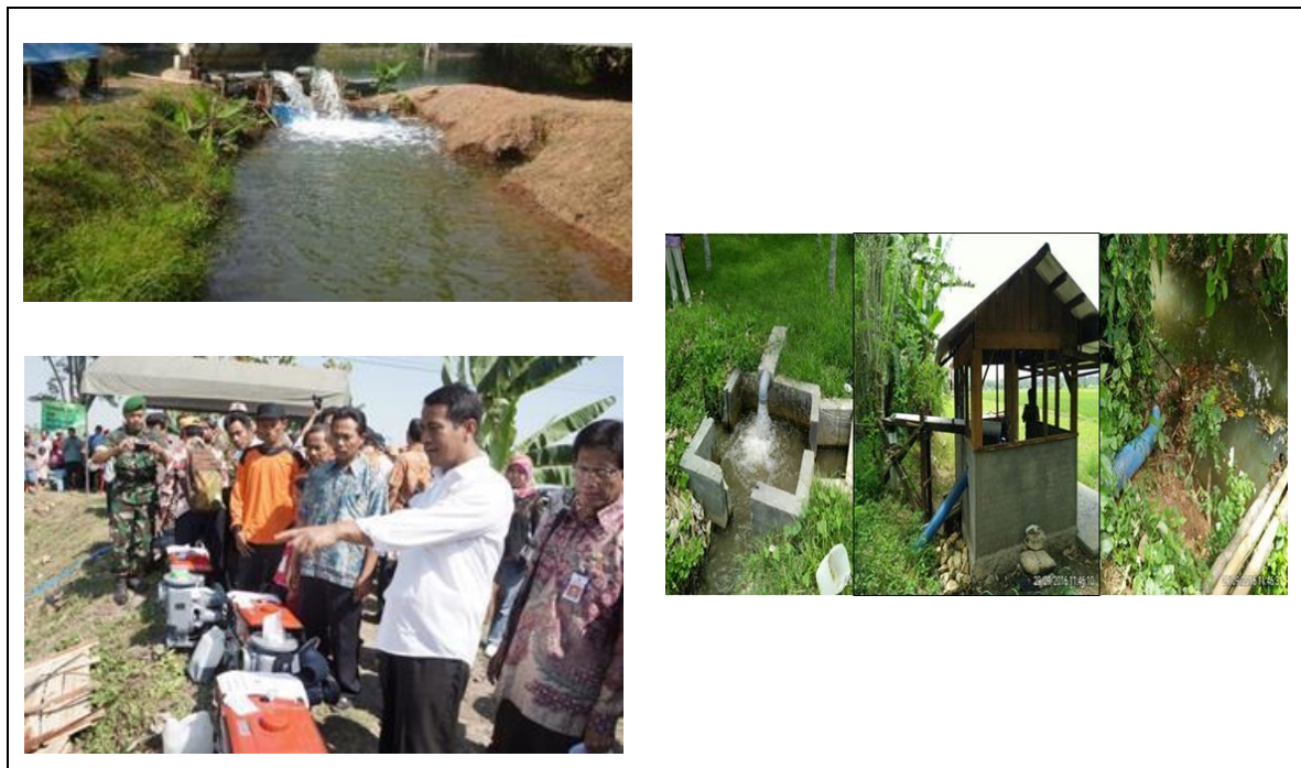
Gambar 3. Pemanfaatan air sungai dengan pompanisasi di Sungai Ciliuk, Desa Jaro, Kecamatan Jaro, Kabupaten Tabalong, Kalimantan Selatan

Pada Gambar 3 disajikan pemanfaatan air sungai dengan pompanisasi di Sungai Ciliuk, Desa Jaro, Kecamatan Jaro, Kabupaten Tabalong, Kalimantan Selatan.