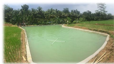
Gambar 5. Embung di desa Ciomas, Kecamatan Tenjo, Kabupaten Bogor

Embung untuk menampung air baik yang berasal dari curah hujan, aliran permukaan maupun mata air, sebagai cadangan air untuk mengatasi kekeringan. Pada Gambar 5 disajikan embung di desa Ciomas, Kecamatan Tenjo, Kabupaten Bogor.