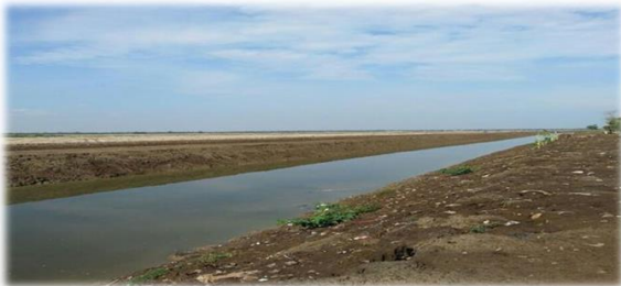
Gambar 6. Long storage di desa Panyindangan Wetan, Kecamatan Sindang, Kabupaten Indramayu

Pada Gambar 6 disajikan long storage di desa Panyindangan Wetan, Kecamatan Sindang, Kabupaten Indramayu