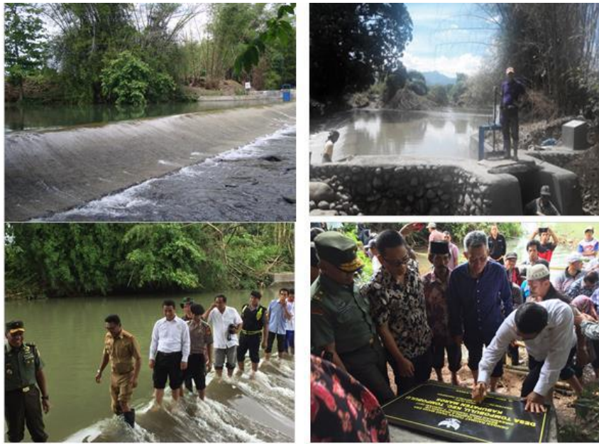
Gambar 4. Dam parit di desa Tompobulu, Kabupaten Maros, Sulawesi Selatan

Tambahan produksi yang diperoleh dalam 1 tahun dengan investasi tersebut sebesar 243 ton GKP setara 899 juta rupiah. Dengan pompanisasi tersebut, Desa Jaro, Kecamatan Jaro, Kabupaten Tabalong, Kalimantan Selatan mendapat tambahan IP sebesar 1,0.