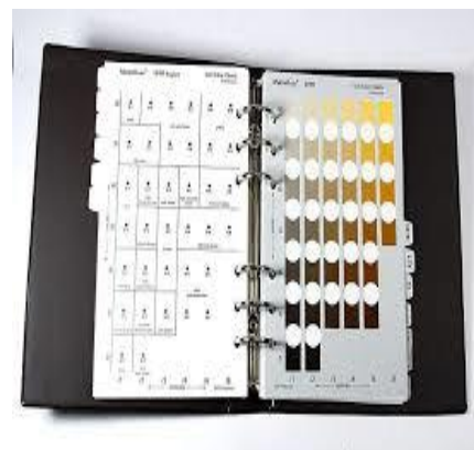
Gambar 2. Penentuan warna tanah dengan MSCC

Dalam konsistensi basah atau lembab, indikator konsistensi dapat dilihat dari tingkat kelekatan dan plastis tanahnya. Untuk hasil percobaan kelekatan dan plastisitas pada wilayah sebelum dan sesudah kebakaran hampir dari keseluruhan hasil sampel memilikitingkat tidak lekat dan tingkat plastis. Tingginya kelekatan atau platisitas sebuah tanah berpengaruh dengan kandungan lempung yang dimiliki oleh tanah itu. Semakin tinggi kandungan lempung suatu tanah maka kelekatan dan plastisitasnya semakin tinggi.