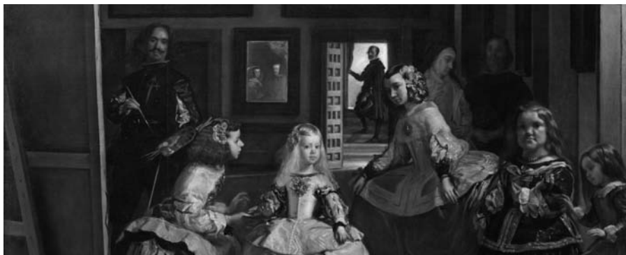
Figura 1. Las Meniñas, de Diego Velázquez.

Talvez haja, neste quadro de Velásquez, como que a representação da representação clássica e a definição do espaço que ela abre. Com efeito, ela intenta representar-se a si mesma em todos os seus elementos, com suas imagens, os olhares aos quais ela se oferece, os rostos que torna visíveis, os gestos que a fazem nascer. Mas aí, nessa dispersão que ela reúne e exhibe em conjunto, por todas as partes um vazio essencial é imperiosamente indicado: o desaparecimento necessário daquilo que a funda daquele a quem ela se assemelha e daquele a cujos olhos ela não passa de semelhança. Esse sujeito mesmo -que é o mesmo- foi elidido. E livre, enfim, dessa relação que a acorrentava, a representação pode se dar como pura representação (Foucault, 1995, p. 21).