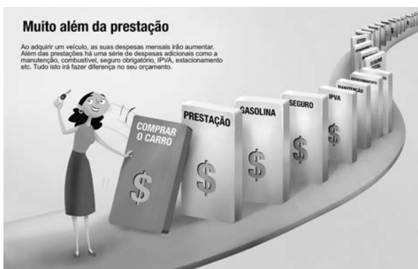
Figura 2. Infográfico sobre as despesas com carro divulgado no portal Meu Bolso feliz. O infográfico ganhou tal importância que pode ser facilmente encontrado em diferentes tipos de publicações, como nas divulgações de trabalhos artísticos ou de pesquisas científicas.