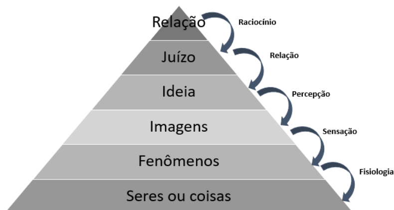
Figura 1 – Desenvolvimento do Raciocínio

Em 1926 Escobar começa a redigir um artigo denominado O conhecimento – noções psicológicas , apesar do título o artigo aborda as questões relacionadas à matemática. O texto era separado por capítulos e que tinha por finalidade descrever como deveria ser o ensino, com vistas a transformar o homem e o mundo por meio da ciência. Os capítulos eram: 1 – o que o aluno deveria fazer na escola; 2 – o conhecimento; 3 – conhecimento das leis: científico; 4 – a matemática; 5 – importância da matemática; 6 – infantaria da matemática; 7 – Precaução no aprender; 8 – o método na matemática; 9 – noções filosóficas; 10 - Síntese. Se conjectura pelo sumário que José Ribeiro Escobar pretendia escrever sobre o ensino da matemática por meio do olhar da psicologia. Ele faz um quadro resumo dessa guerra do conhecimento. O quadro sugere como deve ser o desenvolvido do raciocínio lógico por meio das leis da psicologia.