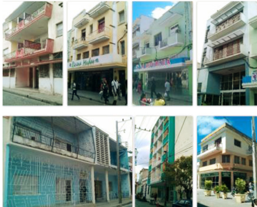
Figura 4. Ejemplares del Movimiento Moderno ubicados en el eje República.

espaciales como formales. Es de destacar la presencia de los edificios de apartamentos del Movimiento Moderno en los ejes fundamentales del centro histórico, como el eje República que tiene la peculiaridad de tener tres de forma continua y tres aislados (Fig. 4).