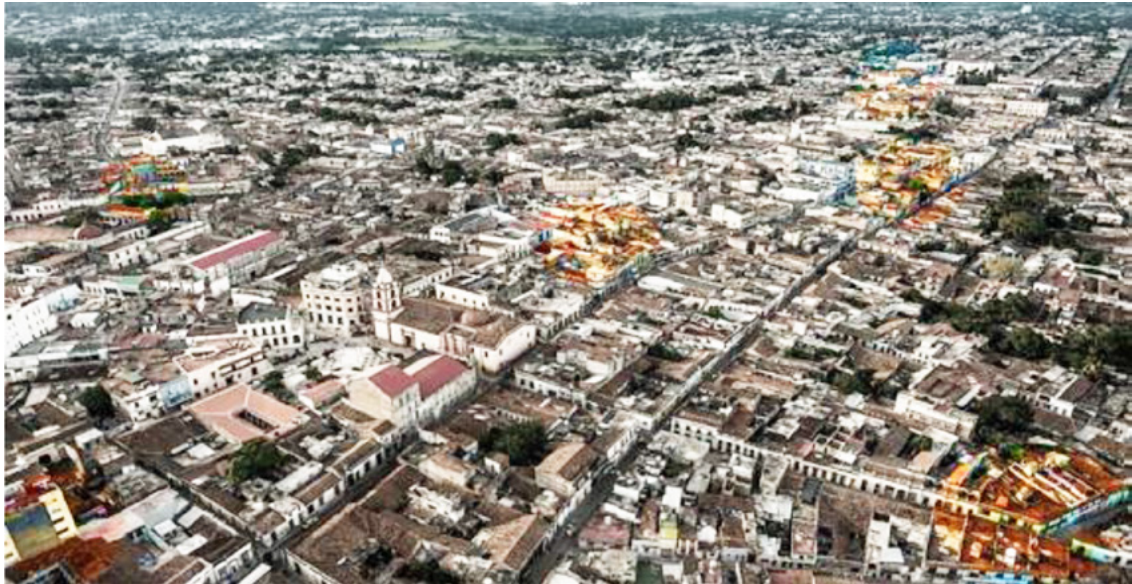
Figura 1. Ubicación en color de algunos de los edificios de apartamentos del Movimiento Moderno que se encuentran ubicados en la ciudad de Camagüey.

Específicamente en la ciudad de Camagüey ocurre el florecimiento de esta nueva arquitectura en la década de 1950 gracias al auge económico de este periodo y aunque el número de obras no se compara con las de La Habana, existen ejemplos que demuestran la adaptación de los códigos del Movimiento Moderno en el territorio. Fue el centro histórico (Fig. 1) la zona elegida para hacer alarde de las nuevas tecnologías y materializar en edificios comerciales, sociales o públicos y de viviendas los nuevos códigos no figurativos.