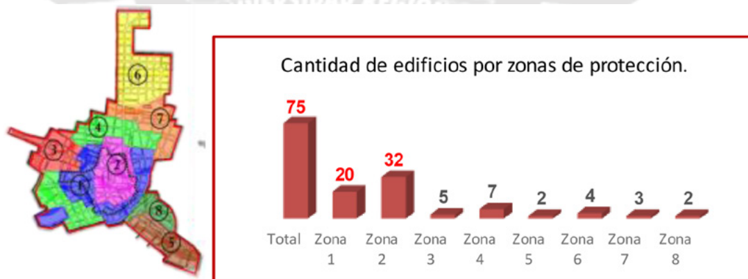
Figura 2 (izquierda). Zonas de protección del centro histórico, marcada la zona declarada

El centro histórico de Camagüey se encuentra dividido en ocho zonas de protección (Fig. 2), coincidentemente una parte importante de las zonas uno y dos forman parte del área que fue inscrita en la lista de Patrimonio de la Humanidad en el 2008, siendo en estas dos zonas donde se encuentra la mayor cantidad de exponentes correspondientes a los edificios de apartamentos del Movimiento Moderno, llegándose a contabilizar 52 inmuebles (Fig. 3).