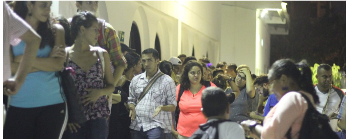
Imagen. Publico en una de las representaciones programadas en "Espacio Transverso"

Al darme cuenta de este espacio, me pareció interesante mantener una fidelidad con las muestras que allí se organizaban, pues estas eran una retroalimentación a la profesión que me encuentro actualmente estudiando. En un principio me mantuve bajo el pretexto de únicamente agendar las programaciones que fueran de mi interés, cohibiendome meramente a algunas muestras de teatro. Al empezar a hacer parte del Semillero TEI en el año 2019, comencé a darme cuenta del error que estaba cometiendo al limitarme a ciertos espacios, por eso, mi invitación es mantenerse activos, abiertos a cada programación, pues cada una no se pierde de la posibilidad de aportar algún conocimiento, experiencia o aprendizaje.