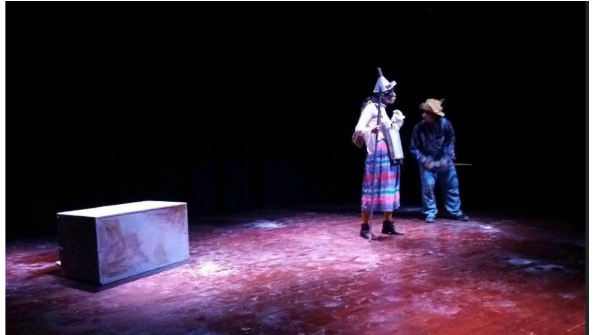
En algunas ocasiones el público ha asistido en masa a nuestra programación

Por Luis Ortiz luis.ortiz.hxh@gmail.com Universidad del Atlántico