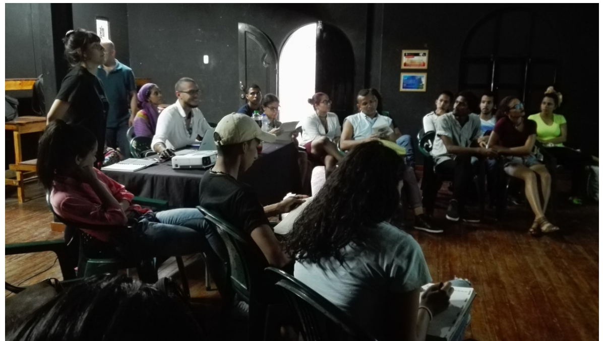
Imagen. Socialización del intercambio internacional “Un hueco en la ciudad”