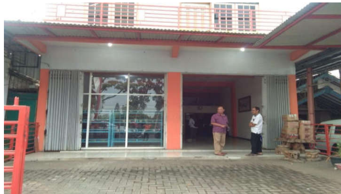
Gambar 2. Bangunan UMKM IMEL

Lokasi UMKM tersebut berada di tepi jalan raya Malang-Surabaya. Bangunan UMKM terdiri dua lantai, yaitu lantai bawah dengan luas bangunan mencapai sekitar 40 m 2 . Demikian pula di lantai atas, luasnya juga sama. Status bangunan sudah menjadi Hak Milik UMKM IMEL. Adapun wujud fisik bangunan tersebut sebagaimana ditunjukkan pada Gambar 2.