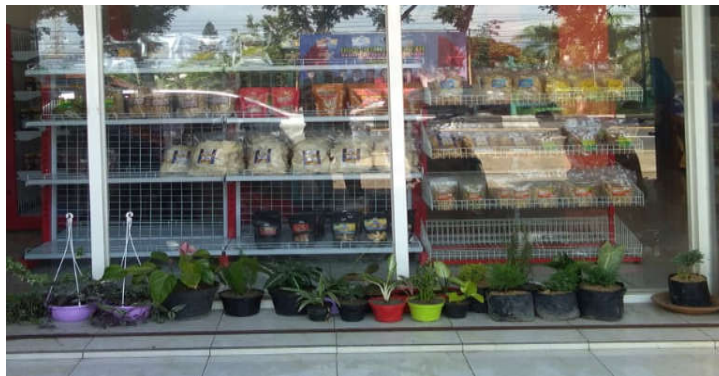
Gambar 5. Outlet Tampak Dari Luar Bagian Depan

Tahap pertama adalah menyampaikan kepada kepala desa, pelaku UMKM dan perangkat desa yang lain bahwa rencana program pengabdian yang sebelumnya sudah disampaikan dipastikan jadi dilakukan di desa Randuagung. Setelah dilakukan diskusi tentang rencana pengembangan usaha maka, segralah dilakukan koordinasi dengan para pelaku UMKM. Kami turut mendampingi mendiskusikan penataan ruangan dan produk-produk UMKM, penataan furniture dan berbagai design tempat yang lain. Adapun perkembangan outlet disajikan pada Gambar 5, 6, dan 7.