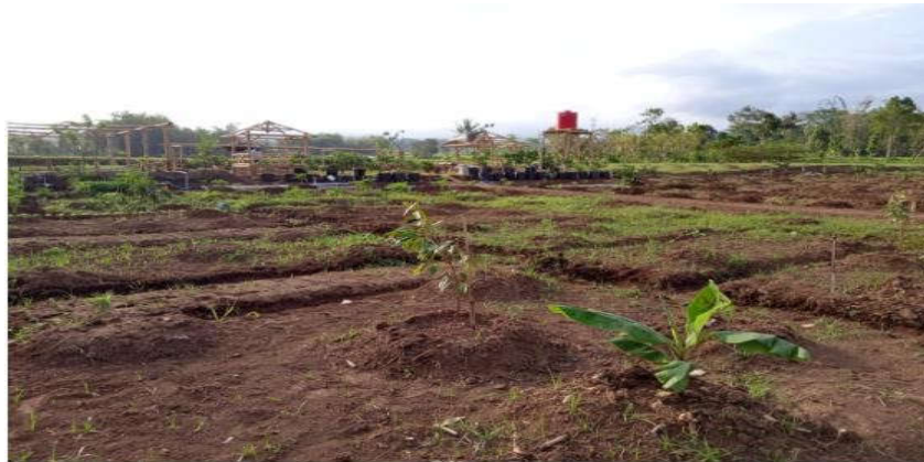
Gambar 1. Rencana Lokasi OVOPoDe

Potensi ketiga yang saat ini juga sedang dirancang untuk semakin diberdayakan adalah kegiatan ekonomi rakyat berbasis produk olahan pertanian, yang dihasilkan oleh warga desa setempat. Menurut kepala desa setempat, ada beberapa UMKM berbasis produk pengolahan pertanian yang memiliki potensi untuk dikembangkan. Oleh karena itu, pemerintah desa sangat konsen untuk memberdayakan UMKM sebagai upaya untuk mendorong pembangunan ekonomi desa tersebut. Salah satu UMKM yang saat ini menjadi perhatian serius dalam program pemberdayaan adalah UMKM IMEL.