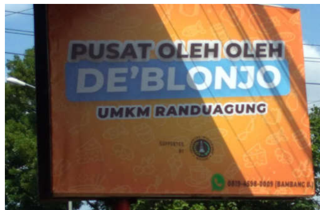
Gambar 7. Foto Billboard.

Hasil perkembangan lain yang sudah diwujudkan adalah dipasangnya billboard dengan bertuliskan Pusat Oleh Oleh De'Blonjo. Billboard ini sekaligus sebagai pembanding dari Billboard yang disajikan pada Gambar 3. Foto Billboard yang baru dirilis sebagaimana disajikan pada Gambar 7.