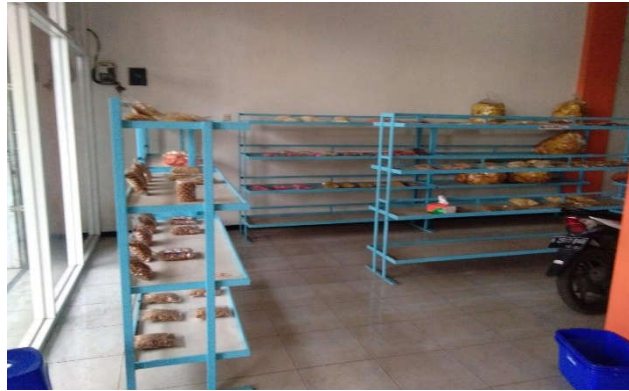
Gambar 3. Kondisi Ruangan dan Cemilan di UMKM Imel

Pemilik UMKM IMEL, sebenarnya sudah kurang bermimnat untuk melanjutkan usaha tersebut, Namun berkat dorongan dari kepala desa, yang menjanjikan untuk turut mengembangkan usaha tersebut, maka timbul semangatnya. Pemilik UMKM IMEL, menyepakati keinginan kepala desa, antara lain untuk menjadikan UMKM IMEL: (a) seperti Inomaret/alfamart, baik sistem pengelolaannya maupun sarana dan prasarana tool nya yang berbasis computer, (2) sebagai tempat untuk menjual produk cemilan karya warga setempat, ditargetkan ada 10 produk cemilan potensial dan apabila dari masing-masing produk tersebut diambil 100 pcs, sehingga akan ada 1000 pcs hasil produk warga yang dijual ditempat ini, (c) tempat belanja yang menarik, yaitu dengan adanya beberapa fasilitas penunjang yang akan akan diperbaiki, yaitu: terasnya akan ditutup gavalum supaya seheinga pengunjung merasa nyaman meskipun hujan bisa turun dengan leluasa, diteras itu juga akan dibikinkan Café mini, dilengkapi juga toilet dan mushola, tempat parkir yang representative dan aman, dan papan nama yang bertulisan Coleh-oleh Khas Randungagung Singosari Malang . Bagian teras dan papan nama disajikan pada Gambar 4.