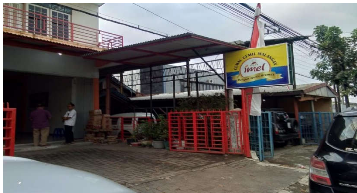
Gambar 4. Keadaan Teras dan Papan Nama UMKM IMEL

Pemilik UMKM IMEL, sebenarnya sudah kurang bermimnat untuk melanjutkan usaha tersebut, Namun berkat dorongan dari kepala desa, yang menjanjikan untuk turut mengembangkan usaha tersebut, maka timbul semangatnya. Pemilik UMKM IMEL, menyepakati keinginan kepala desa, antara lain untuk menjadikan UMKM IMEL: (a) seperti Inomaret/alfamart, baik sistem pengelolaannya maupun sarana dan prasarana tool nya yang berbasis computer, (2) sebagai tempat untuk menjual produk cemilan karya warga setempat, ditargetkan ada 10 produk cemilan potensial dan apabila dari masing-masing produk tersebut diambil 100 pcs, sehingga akan ada 1000 pcs hasil produk warga yang dijual ditempat ini, (c) tempat belanja yang menarik, yaitu dengan adanya beberapa fasilitas penunjang yang akan akan diperbaiki, yaitu: terasnya akan ditutup gavalum supaya seheinga pengunjung merasa nyaman meskipun hujan bisa turun dengan leluasa, diteras itu juga akan dibikinkan Café mini, dilengkapi juga toilet dan mushola, tempat parkir yang representative dan aman, dan papan nama yang bertulisan Coleh-oleh Khas Randungagung Singosari Malang . Bagian teras dan papan nama disajikan pada Gambar 4.