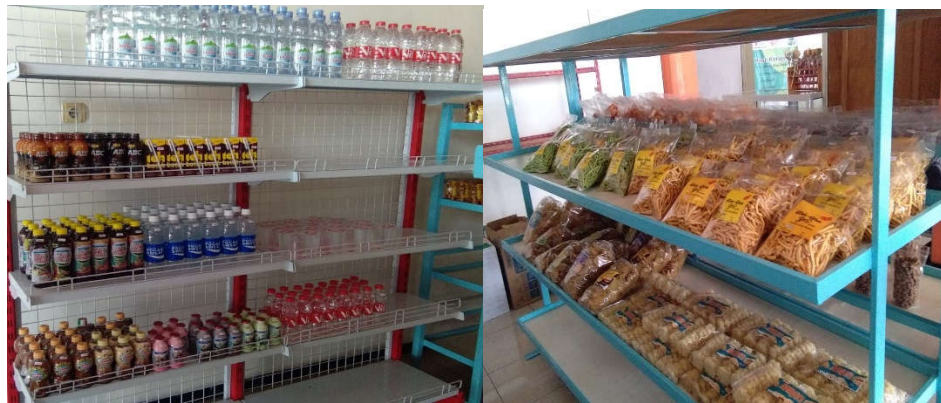
Gambar 6. Foto Produk UMKM di Dalam Outlet

Berdasarkan foto-foto produk UMKM pada Gambar 6 dapat ditunjukkan bahwa produk yang dijual di outlet ini makin beragam. Ada makanan camilan, minuman dan juga batik khas Randuagung. Berdasarkan pada Gambar 6, sekaligus menunjukkan betapa antusiasnya para pelaku UMKM untuk memanfaatkan outlet tersebut. Minimal untuk setiap item produk tersedia 10 pcs. Berdasarkan kesepakatan produk-produk UMKM yang dipasarkan lewat outlet ini masih terbatas pada produk UMKM yang sudah eksisi dan potensial. Ke depan, semua produk UMKM yang dihasilkan oleh semua penduduk desa Randuagung akan dijual melalui outlet ini. Outlet tersebut, sekaligus menjadi proyeksi pusat oleh-oleh bagi wisatawan yang menikmati wisata alam di desa Randuagung.