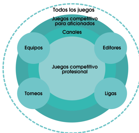
Figura 1: Ecosistema del eSport

Tanto en el deporte tradicional como en el eSport frecuentemente se organizan torneos con premios atractivos para los ganadores. Llama la atención que las cifras (montos) que se ofrecen guardan una estrecha similitud- por lo menos en USA- : Epic Games en el 2019 para el campeonato mundial de Fornite en Natación tuvo un premio por valor 100 millones de dólares. En Alemania, el torneo de exhibición de Jackspot ESL One Cologne tuvo premios por valor de 300.000 dólares (Seibold, 2019). Los grandes eventos innegablemente han contribuido al crecimiento de las audiencias e interacciones. En el 2018 se jugaron más de 730 eventos con premios en efectivo por un total de 48 millones de euros (Statista, 2019).