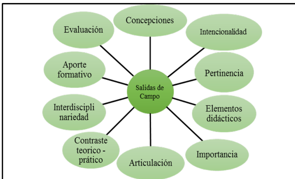
Figura 2. Red de subcategorías de las salidas de campo.

Respecto a la perspectiva sistémica, esta se orienta a la consolidación de un sistema de conocimientos y saberes en el proceso educativo impartido por el docente. En este sentido, de acuerdo con las voces de los participantes de las universidades objeto de estudio, se evidencian vacíos en los aspectos de evaluación y aporte formativo, dado que, por un lado, en dichos programas es notable el apego a la forma tradicional con mecanismos de evaluación estandarizados, y por el otro, no se aprovechan los productos investigativos y formativos que se generan a la hora de desarrollar las salidas de campo.