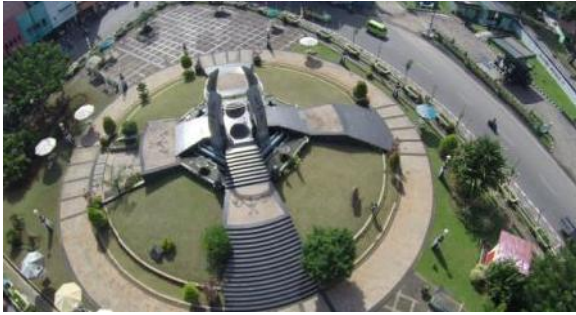
Gambar 3. Gong Perdamaian Dunia