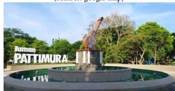
Gambar 2. Taman Pattimura