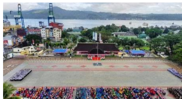
Gambar 1. Lapangan Merdeka

Monumen dr. Johannes Leimena yang diresmikan pada tahun 2012 oleh Presiden SBY menempati tempat kedua dalam survei dan diikuti oleh Ruang Terbuka Publik Amahusu Beach atau yang lebih dikenal dengan Pantai Amahusu di tempat keempat.