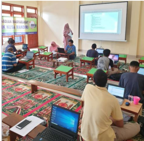
Gambar 5. Lanjutan Materi

Pada gambar 4 merupakan hari kedua yang mana pemateri mulai memberikan penjelasan tentang membuat program terstruktur, program yang disampaikan berupa materi php [6] dan juga pengenalan Content-Management-System Wordpress [7] dengan penyampaian sederhana.