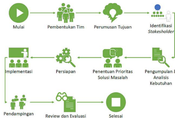
Gambar 2. Metode Penelitian

Gambar 2, metode yang digunakan dalam Pengabdian Kepada Masyarakat kali ini adalah dengan menggunakan metode sebagai berikut [5]: