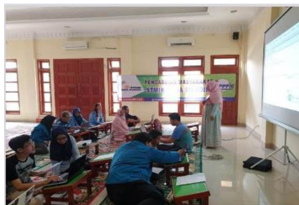
Gambar 4. Penyampaian Lanjutan Pelatihan

Pada gambar 3 terlihat pemateri menyampaikan materi dasar terlebih dahulu mengenai dasar programming dan instalasi perangkat lunak sesuai kebutuhan.