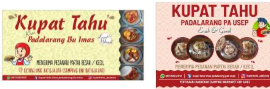
Gambar 2. Desain Spanduk Usaha