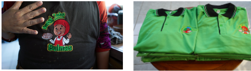
Gambar 4. Seragam dan Upron Karyawan