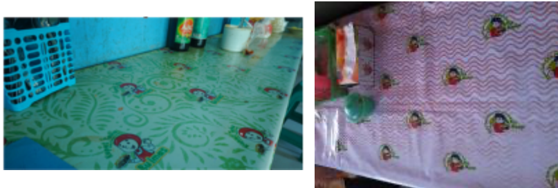
Gambar 5. Penataan Layout Warung Usaha

Dalam pra-survei, kami mengidentifikasi bahwa persepsi konsumen terhadap kualitas penataan dan kebersihan warung masih rendah. Oleh sebab itu dilakukan pengaturan lingkungan usaha mitra fokus pada penataan tempat supaya ergonomis, penataan kembali peralatan memasak produk kupat tahu, kompor, panci, display produk, piring, sendok, garpu, kecap, tempat sambal dan tempat cuci piring. Pengaturan tersebut dilakukan untuk memudahkan pelayanan sehingga pekerjaan dapat efektif dan efisien dalam melayani pelanggan.