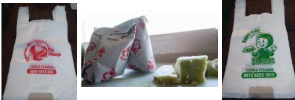
Gambar 3. Desain Kemasan Produk