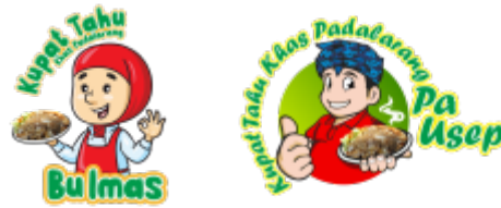
Gambar 1. Logo Usaha Mitra

Identifikasi kebutuhan identitas merek usaha bagi para mitra telah didiskusikan bersama dengan tenaga profesional dibidang desain logo dan kemasan. Adapun hasil identitas merek usaha yang telah diciptakan dalam program ini seperti terlihat pada gambar-gambar berikut.