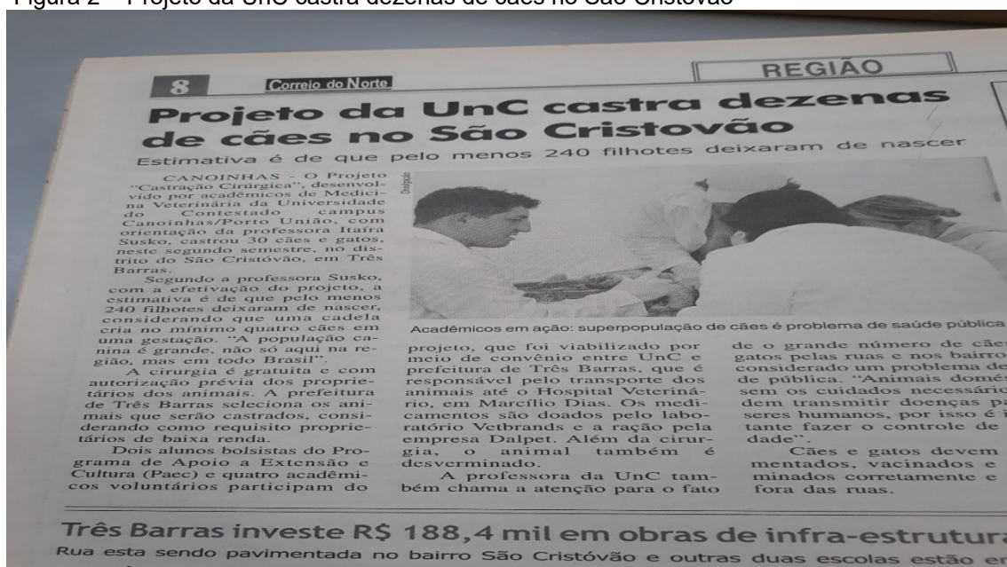
Figura 2 – Projeto da UnC castra dezenas de cães no São Cristóvão