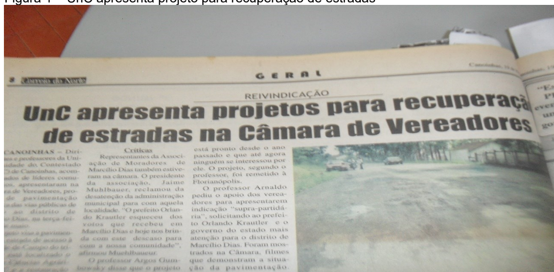
Figura 1 – UnC apresenta projeto para recuperação de estradas

Dentre as preocupações iniciais da nova década estava a infraestrutura da Universidade, que possuía quatro espaços no município de Canoinhas e um Núcleo Universitário no município de Porto União, distante 70 km de Canoinhas. Dentre esses espaços, destaca-se o novo campus construído no distrito de Marcílio Dias, o qual, no projeto original, congregaria todas as atividades de ensino, pesquisa e extensão. A UnC, juntamente com lideranças, apresentou na Câmara de Vereadores o projeto de melhoria da pavimentação asfáltica da via pública de acesso ao distrito de Marcílio Dias e sua extensão ao novo campus. O segundo trecho, ainda de chão batido, causava inúmeros transtornos para o deslocamento até o campus. Almejava-se, assim, contribuir para o desenvolvimento do distrito, um dos berços da colonização do município.