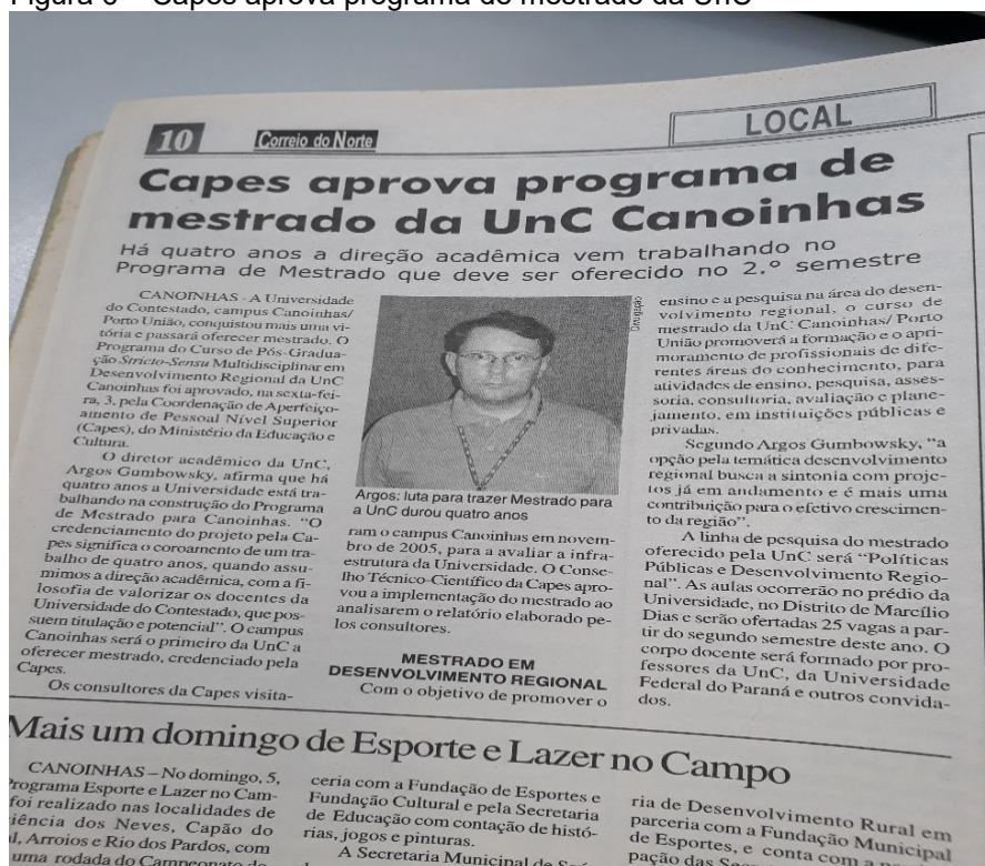
Figura 6 – Capes aprova programa de mestrado da UnC