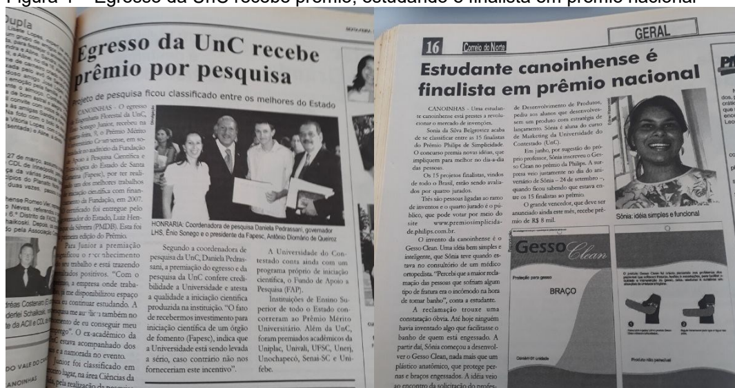
Figura 4 – Egresso da UnC recebe prêmio, estudando é finalista em prêmio nacional

Essas premiações são exemplos de ações que auferiam credibilidade ao trabalho que a UnC realizava na região, contribuindo veementemente com o desenvolvimento regional.