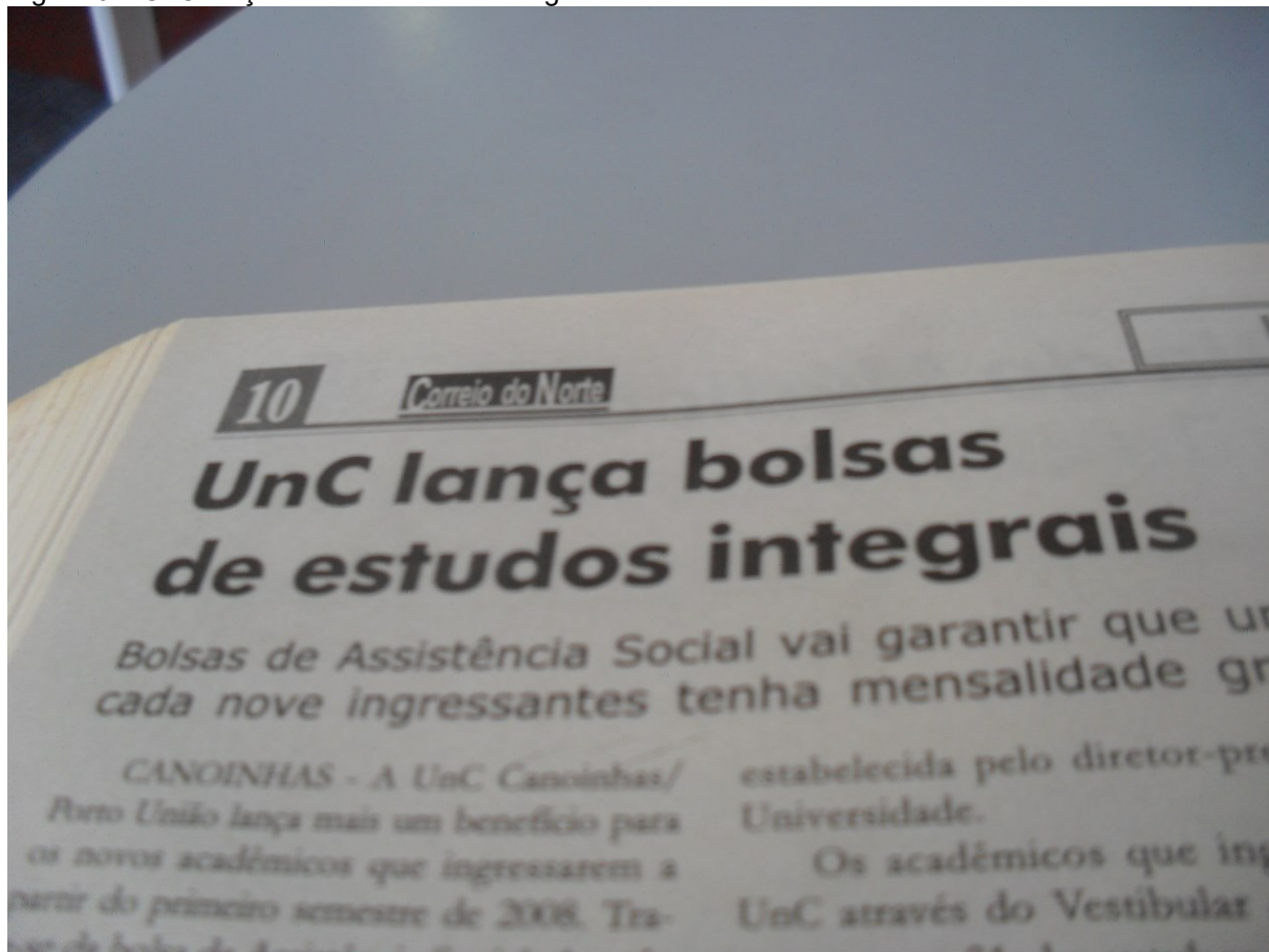
Figura 6 – UnC lança bolsa de estudos integrais.

mantenedora, disponibilizava bolsa de estudos integrais, resultante da condição de instituição filantrópica, como é possível observar na Figura 6: