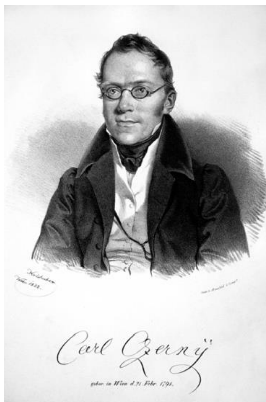
Fig. 4: Carl Czerny (litografía de Josef Kriehuber, 1833)

En 1842, el alumno de Beethoven, Carl Czerny, informó que su maestro se había dejado inspirar en muchas de sus obras más bellas gracias a sus propias visiones e imágenes literarias. A este respecto mencionó como ejemplos concretos el “Adagio” en Mi Mayor del Cuarteto de Cuerdas en mi menor op. 59, n° 2 y la Séptima . Por último, Beethoven -como Czerny afirmó-, al igual que Wellingtons Sieg oder die Schlacht bei Vittoria , se sintió influenciado por los sucesos de 1813 y 1814 (Czerny, ed. de Badura-Skoda, 1963, p. 62). Esta información es incorrecta ya que la Séptima , como se ha mencionado con anterioridad, ya se había completado en junio de 1812.