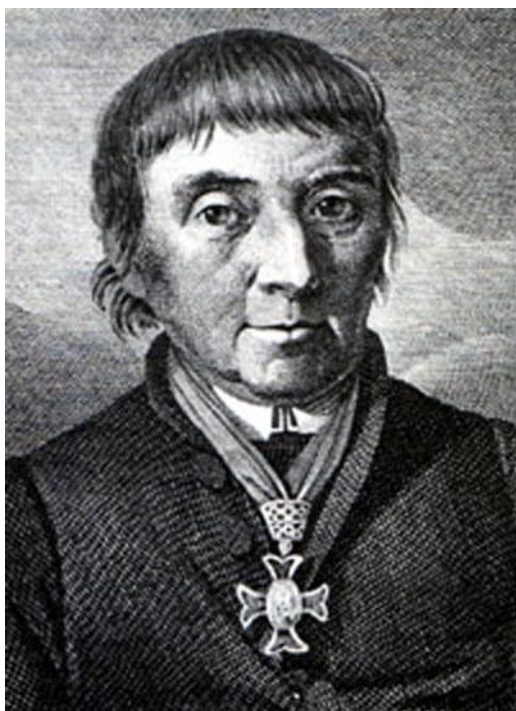
Fig. 3: Maximilian Stadler (1818).

ceremonial Trío domina la sonoridad del viento metal. El movimiento de la Séptima más complicado desde el punto de vista rítmico es el “Finale”, el cual ofrece una colorida imagen de variedad rítmica: estructuras téticas y anacrúsicas sucediéndose alternativamente en varias ocasiones, ritmos de puntillo en ostinato, animadas síncopas y sforzati sobre partes débiles del compás otorgan a la composición una energía increíble –por momentos resuena la música como si fuera una marcha rápida en 4/4, aunque está escrita en 2/4.