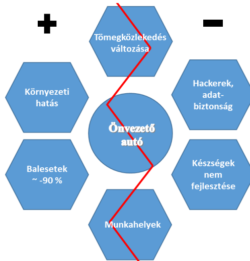
1. ábra: Összefoglaló a pozitív és negatív változásokról Diagram 1: Summary of positive and negative changes

minimalizálják az utasok nélküli utazásokat (UCS, 2017; Alton, 2018). Tehát a későbbiekben fontos, hogy amellet, hogy az emberek kényelmesebben szeretnének utazni, képesek legyenek megérteni, hogy az autómegosztás a környezetre is pozitív hatással van, nem csak a dugók elkerülésére.