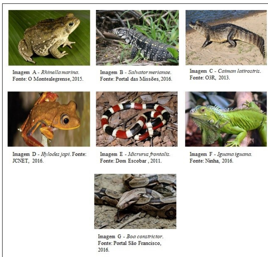
Figura 1. Imagens estímulos apresentados no teste de evocação livre

Os dados foram analisados através do método de análise de conteúdo (Bardin, 2011). Segundo Silva,