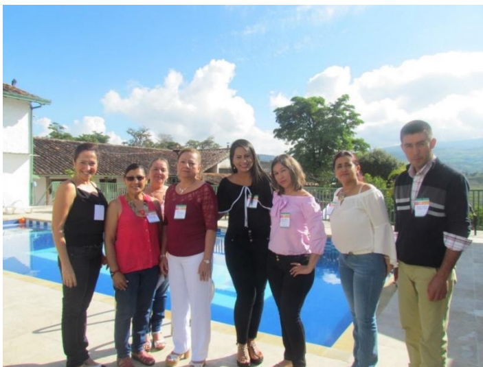
Figura 1. Docentes líderes de las estrategias didácticas.

Teniendo en cuenta el papel que el cuidado de la vida tiene como manifestación de la ciudadanía en la sociedad actual, es adecuado resaltar cómo las dos estrategias en las que se pudo vincular directamente la práctica docente con dicha manifestación se desarrollaron en contextos rurales. Sin duda alguna es mucho más fácil para los niños entender la necesidad humana de cuidar la vida, y de todas las relaciones que de este cuidado se desprende, si conviven con la naturaleza. El cuidado de los árboles, una acción quizá totalmente impensable para muchos ciudadanos, es aprendida por los niños rurales de forma cotidiana.