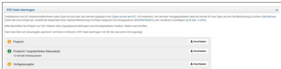
Abb. 2: Bewerbung eines Postprint nach dem Zweitveröffentlichungsrecht.

Die automatische Nutzerführung in KITopen bietet noch weitere Komponenten, die in vielen Fällen die Einblendung einer grünen Ampel ermöglicht und somit Open Access befördern: