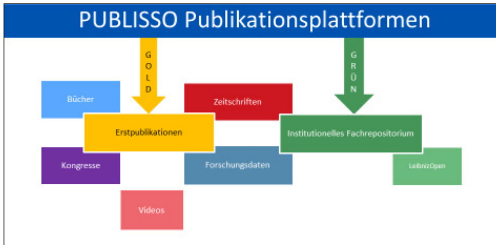
Abb. 4: Die PUBLISSO-Publikationsplattformen „gold“ und „grün“