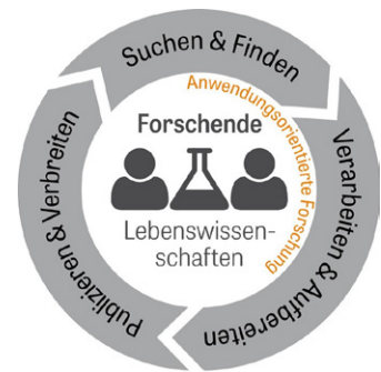
Abb. 1: Forschungskreislauf ZB MED

In der Gesamtsicht betrachtet stellt ZB MED mit dieser Aufgabenpalette, die sich an den neuen Herausforderungen des modernen Bibliothekswesens ausrichtet, die Versorgung mit Informationen als zentrale Anlaufstelle in den Lebenswissenschaften sicher. Dabei wird im Handlungsfeld „Suchen & Finden“ durch das neue Suchportal für die Lebenswissenschaften „LIVIVO“ 3 ein verbessertes Auffinden von wissenschaftlichen Forschungserkenntnissen durch innovative Technologie ermöglicht. Zusätzlich wird ein möglichst umfassender digitaler Zugang zu Literatur und Forschungsdaten durch neue Lizenzen und Lizenzmodelle geboten. Im Sinne einer zukunftsorientierten Bestandsentwicklung wird auch vermehrt auf die Einbindung von Quellen geachtet, die Open Access zur Verfügung stehen.