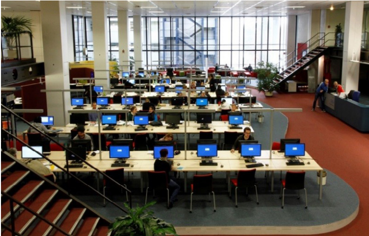
BBM nach dem Umbau, © Dagmar Härter

Im Ergebnis des Umbaus des Campus-Nord sind auch an den dort angesiedelten dezentralen SUB-Standorten zahlreiche neue Arbeitsräume und -plätze geschaffen worden.