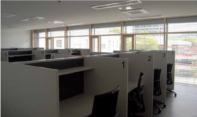
Lern- und Studiengebäude Lernboxen