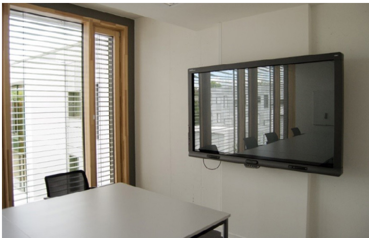
Lern- und Studiengebäude 8er Gruppenarbeitsraum mit Smartboard, © Anna Groh