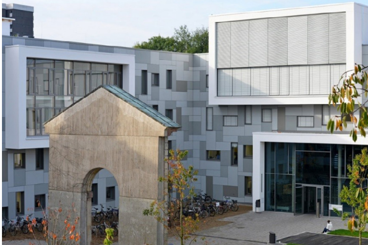
Lern- und Studiengebäude Außenansicht