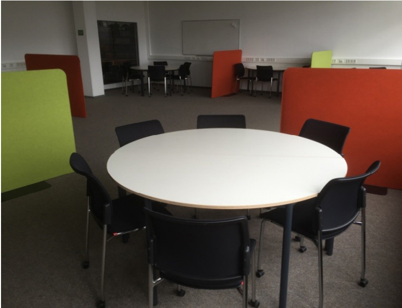
BBC neue Gruppenarbeitsplätze