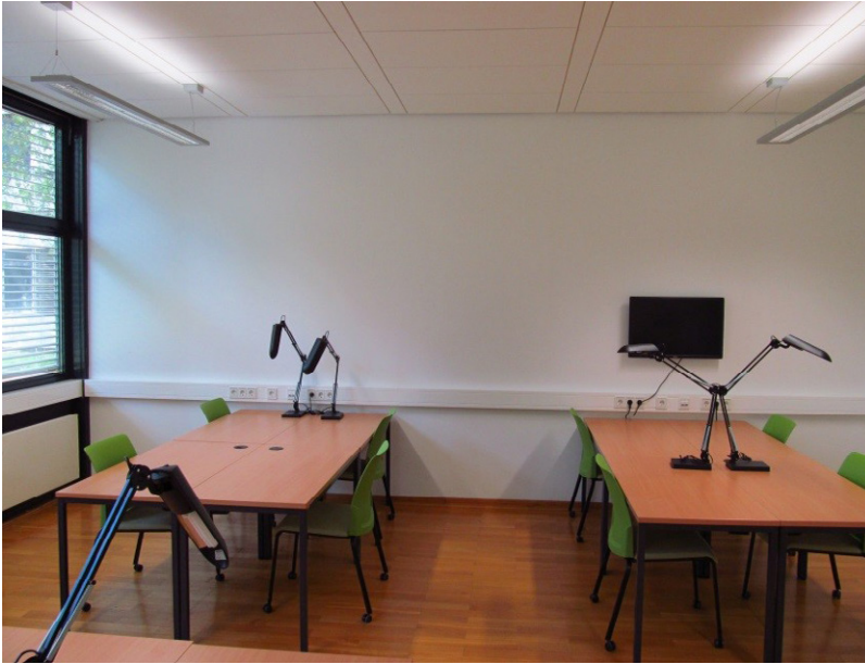
BBF neue Gruppenarbeitsplätze mit Monitor