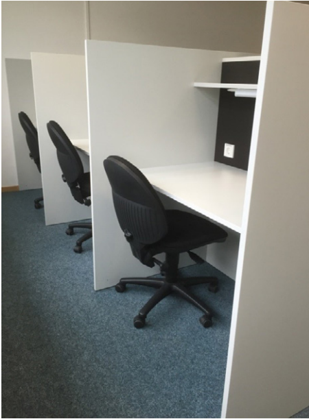
BBP neue Einzelarbeitsplätze