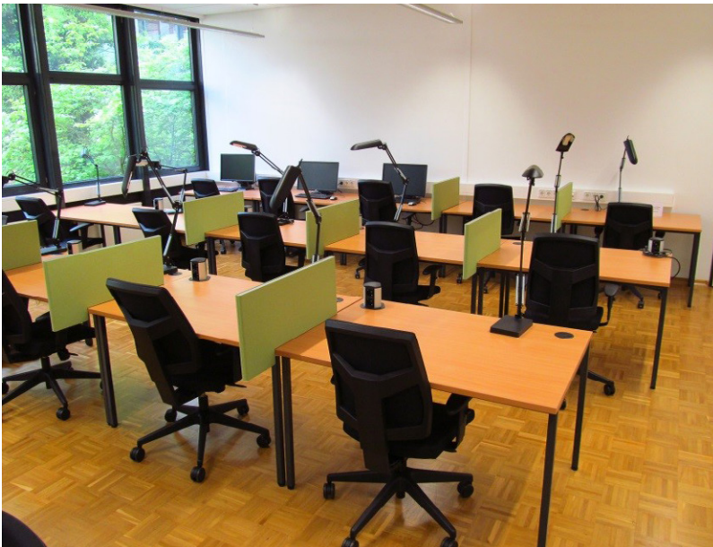
BBF neue Einzelarbeitsplätze