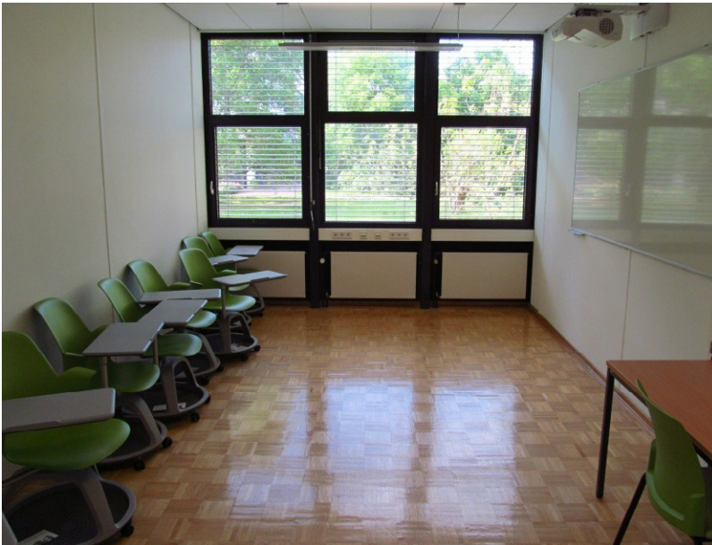
BBF neue mobile Gruppenarbeitsplätze mit Beamer und Whiteboard