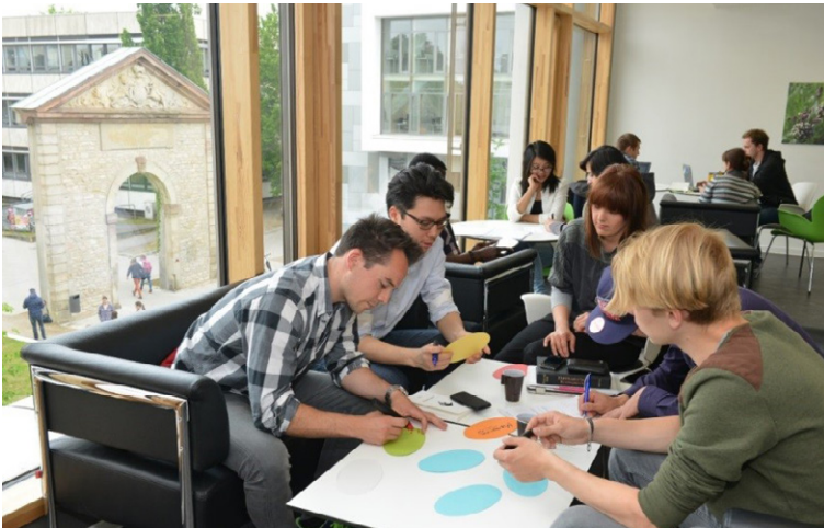
Lern- und Studiengebäude Pausenraum