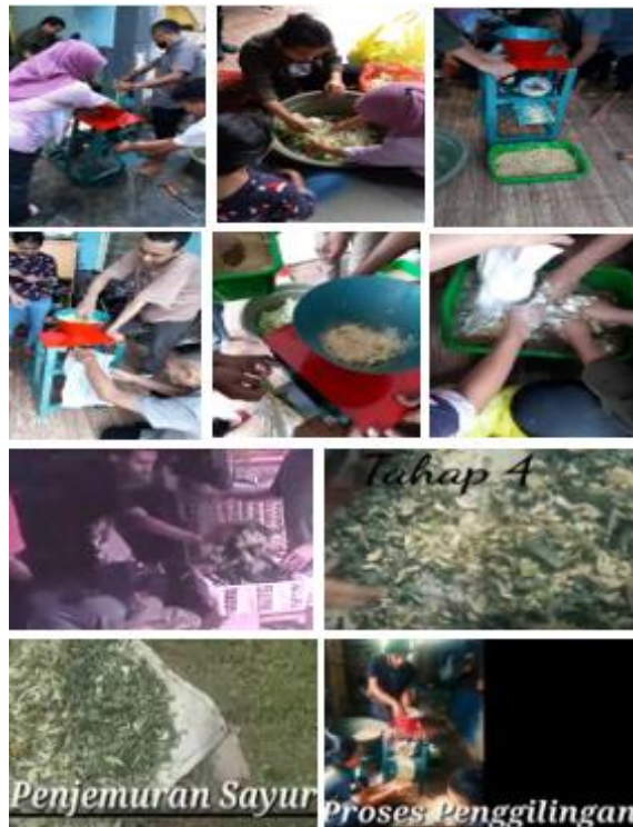
Gambar 2. Pelatihan Pembuatan Pelet Pakan Ayam