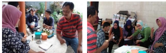
Gambar 1. Pelatihan Penyusunan Formulasi Pelet

Kegiatan untuk peningkatan bidang manajemen usaha telah dilakukan dalam bentuk pembuatan sarana promosi usaha (stiker produk karkas, stiker produk sayur, leaflet, banner, dan poster), pemberian materi tahapan pembuatan buku kas sederhana, serta perhitungan analisa usaha. Kegiatan pelatihan tidak dilakukan secara tatap muka langsung, namun melalui pemberian materi secara online kepada ketua kelompok mitra dan pemberian contoh analisa usaha sederhana. Kegiatan-kegiatan pelatihan didalam dokumentasi foto adalah kegiatan yang dilakukan sebelum ditetapkan pandemi COVID-19 dan sebelum PSBB. Kegiatan pelatihan penyusunan formulasi pakan, pelatihan pembuatan pelet, mesin pembuatan pelet pakan ayam, serta produk hasil mitra, dapat dilihat pada Gambar 1, 2, 3, dan 4.