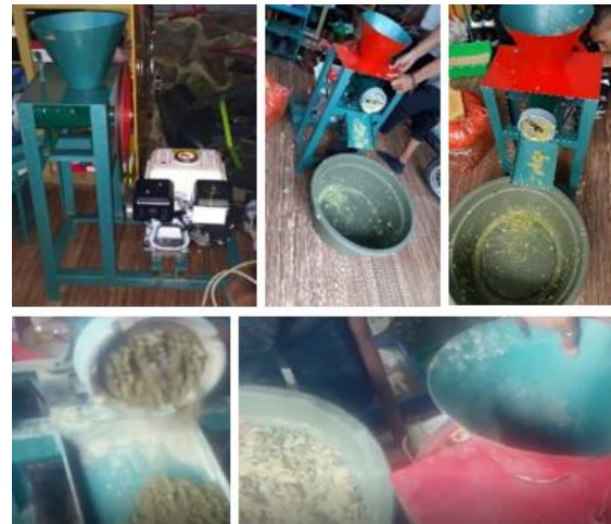
Gambar 3. Mesin Pembuat Pelet Pakan Ayam