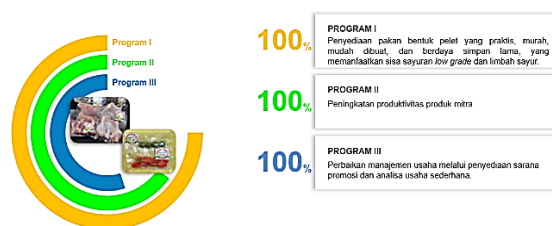
Gambar 5. Program dan Kegiatan PPM, serta Ketercapaiannya

Dampak kegiatan PPM yang dirasakan oleh mitra adalah meningkatnya pengetahuan dan keterampilan mitra dalam berbagai kegiatan yang telah disusun bersama dalam rangka untuk pencapaian indikator kerja. Ketercapaian indikator tersebut tidak hanya untuk semua indikator kerja utama (Tabel 2), namun juga ketercapaian terhadap indikator kerja tambahan yaitu penambahan 1 jenis pelatihan penyusunan ransum pakan ayam jabbrama, 1 jenis pakan ayam jabbrama berbentuk pelet yang memanfaatkan sisa sayuran low grade dan limbah sayur, serta terciptanya desain mesin pembuat pelet.