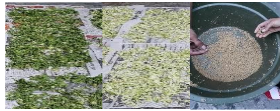
Gambar 2. Pelatihan Pembuatan Pelet Pakan Ayam (Lanjutan)