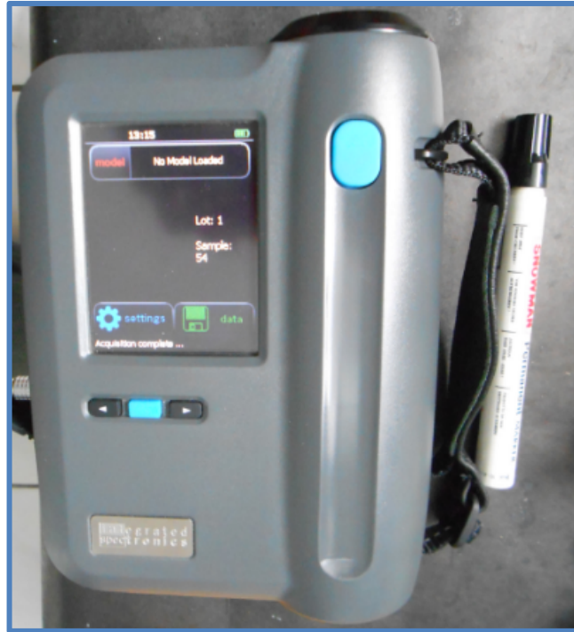
Gambar 1. Spektrometer Nirvana AG410.

partial least squares regression (PLSR). Hasil analisis regresi berupa model kalibrasi, kemudian divalidasi menggunakan teknik validasi silang ( cross validation ). Selain penerapan validasi silang, model kalibrasi dievaluasi pula dengan mempertimbangkan nilai koefisien determinasi ( R^2 ), principal component (PC), root mean squares error of calibration (RMSEC), root mean squares error of cross validation (RMSECV), dan ratio of performance to deviation (RPD).