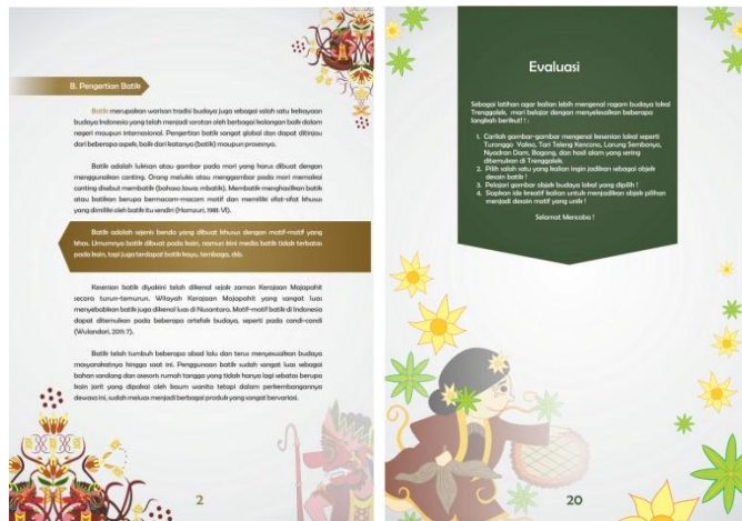
Gambar 1. Lay Out Penyajian