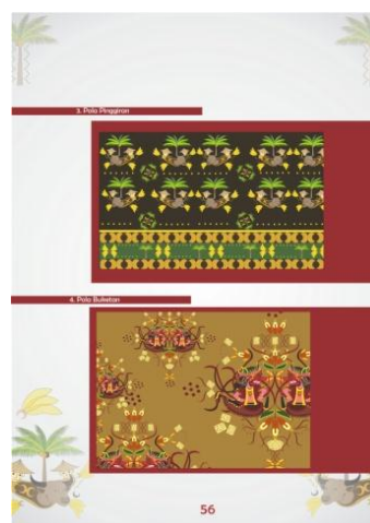
Gambar 4. Format contoh pola motif