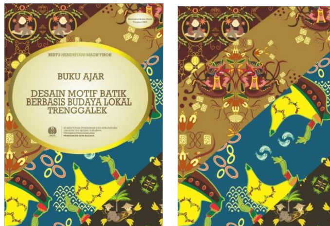
Gambar 2. Desain Cover Belakang

Pemaknaan gambar objek desain motif didasarkan pada karakter wujud objek dan penggunaan warna. Pengembangan ide desain tidak harus menyerupai wujud asli, namun tetap menunjukkan karakternya. Pemberian warna pada objek desain disesuaikan dengan karakternya.