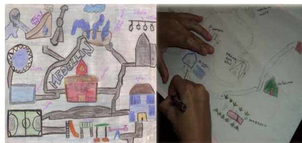
Figura 4. Mapeo de lugares cercanos por estudiantes de grado sexto.

Las siguientes dos tablas (tablas 1 y 2) sintetizan el proceso de sistematización de los datos, lo cual permitió adelantar el análisis, la elaboración del informe final y, posteriormente, la construcción de la estrategia didáctica “Reconozco mi lugar en el mundo”. Estas ayudaron a la tipificación de los lugares y a relacionarlos con los sentimientos generados en los estudiantes participantes.