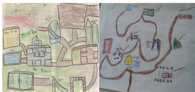
Figura 3. Mapas de la ciudad de Medellín elaborados por estudiantes del grado sexto de la IE Fe y Alegría La Cima.

Los jóvenes participantes en el estudio señalaron aquellos lugares cercanos a sus afectos, sus experiencias, su familia, amigos y compañeros del colegio. Destacaron lugares que permiten el esparcimiento como los parques recreativos (Parque Norte, Parque de las Aguas y Juan Pablo Segundo) y aquellos que ofrecen entretenimiento como los cines, el circo, el Parque de los Deseos, el Parque de los Pies Descalzos, entre otros. Asimismo, se identificaron otro tipo de lugares ligados a las actividades deportivas como el estadio, la cancha de San Blas, La Unidad Deportiva de Belén, las piscinas del Instituto de Recreación y Deportes de Medellín (INDER), la pista de bicigrós, el gimnasio, las canchas de fútbol y de básquetbol, aparte de lugares lúdicos como Divercity, el Parque Explora y el Museo del Agua. A continuación, se comparten dos mapas dibujados por estudiantes participantes de la investigación donde se representan algunos de los lugares anteriormente señalados (figuras 3 y 4).