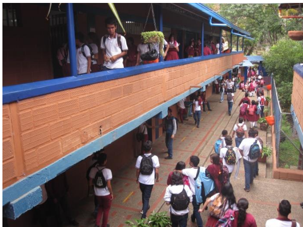
Figura 2. Infraestructura de la institución.