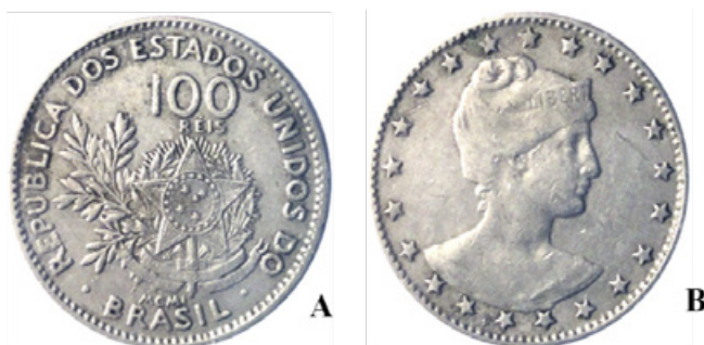
Figura 2. A e B: Moeda de 100 réis (mil réis) – A) Anverso: ramos de café. B) Reverso: Figura feminina representando a República e a liberdade.

Essa moeda (Fig. 2A e 2B) foi cunhada durante o Brasil República (BCB, 2016).