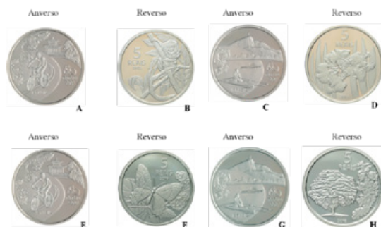
Figura 11. A e B: Moeda de 5 reais (não circulada). A) Averso: atividade de ciclismo pelo Rio de Janeiro no Parque da Tijuca. B) Reverso: Mico Leão Dourado. C e D: Moeda de 5 reais (não circulada). C) Averso: atividade de remo pelo Rio de Janeiro na Lagoa Rodrigo de Freitas. D) Reverso: orquídea. E e F) Moeda de 5 reais (não circulada). E) Averso: atividade de ciclismo pelo Rio de Janeiro no Parque da Tijuca. F) Reverso: borboleta-da-praia. G e H: Moeda de 5 reais (não circulada). G) Averso: atividade de remo pelo Rio de Janeiro na Lagoa Rodrigo de Freitas. H) Reverso: a árvore pau-brasil e, na lateral, destaque para um de seus ramos de folhas e flores.