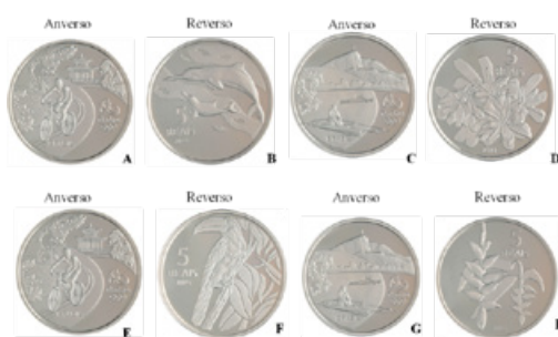
Figura 10. A e B: Moeda de 5 reais (não circulada). A) Averso: atividade de ciclismo pelo Rio de Janeiro no Parque da Tijuca. B) Reverso: toninhas. C e D: Moeda de 5 reais (não circulada). C) Averso: atividade de remo pelo Rio de Janeiro na Lagoa Rodrigo de Freitas com o Corcovado ao fundo. D) Reverso: conjunto de bromélias. E e F: Moeda de 5 reais (não circulada). E) Averso: atividade de ciclismo pelo Rio de Janeiro no Parque da Tijuca. F) Reverso: tucano-de-bico-preto. G e H: Moeda de 5 reais (não circulada). G) Averso: atividade de remo pelo Rio de Janeiro na Lagoa Rodrigo de Freitas com o Corcovado ao fundo. H) Reverso: botânica: exemplar de uma helicônia - planta ornamental originária da América do Sul.

Diante do exposto, torna-se relevante a conscientização das pessoas em relação aos impactos causados pela ação humana no planeta. Estes temas permitem a reflexão sobre hábitos de consumo, sobre a perda da biodiversidade e principalmente, em relação a sobrevivência da espécie humana em um planeta em crise. Sugere-se, portanto que o professor, possa trabalhar acerca da conscientização e reflexão dos alunos sobre hábitos, o papel e o impacto que cada um pode exercer no meio ambiente.