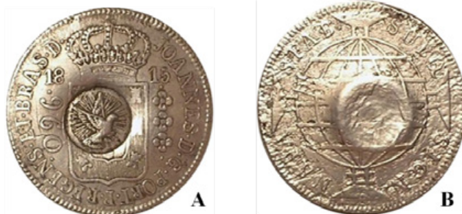
Figura 1. A e B: Moeda de 960 réis – A) Anverso. B) Reverso.