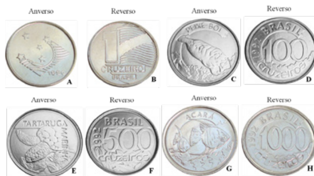
Figura 7. A e B: Moeda de 1 Cruzeiro- A) Anverso: Bandeira, Cruzeiro do Sul e data. B) Reverso. C e D: Moeda de 100 Cruzeiros - C) Anverso: figura do peixe-boi. D) Reverso. E e F: Moeda de 500 Cruzeiros – E) Anverso: figura da tartaruga marinha. F) Reverso. G e H: Moeda de 1000 Cruzeiros - G) Anverso: figura de dois peixes acarás. H) Reverso.

Pode-se utilizar como estratégia de ensino abordar a situação dos animais da fauna brasileira que correm risco de extinção, além das principais ameaças e formas de conservação. Pode ser feito também um trabalho de caracterização da fauna brasileira levando-se em consideração o déficit de estudos que existe e um trabalho de educação ambiental em torno das espécies que estão ameaçadas.