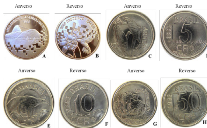
Figura 8. A e B: Moeda de 2000 Cruzeiros. A) Anverso: morros do Pão de Açúcar e da Urca, no Rio de Janeiro. B) Reverso: orquídea e beija-flor. C e D: Moeda de 5 Cruzeiros Reais. C) Anverso: duas araras. D) Reverso. E e F: Moeda de 10 Cruzeiros Reais. E) Anverso: tamanduá. F) Reverso. G e H: Moeda de 50 Cruzeiros Reais: G) Anverso: onça-pintada. H) Reverso.

Em relação as moedas que exibem os mamíferos, o professor pode trabalhar com seus alunos a relação existente entre o ser humano e a natureza e o avanço das áreas urbanas sobre os habitats naturais. O professor pode mencionar, a exemplo, as rodovias: elementos que convertem os ambientes naturais em artificiais no processo de desenvolvimento da sociedade (Guimarães et al., 2018), ressaltando o fato de que os mamíferos são os animais atropelados com maior frequência (Deffaci et al., 2016).