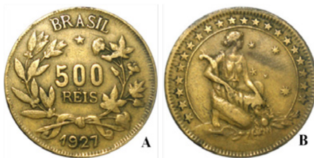
Figura 3. Moeda de 500 réis – A) Anverso: ramos de café e algodão. B) Reverso: a figura da abundância, com joelho apoiado em terra, tendo na destra uma cornucópia; no campo ao lado, a constelação do Cruzeiro do Sul. Em orla 21 estrelas.