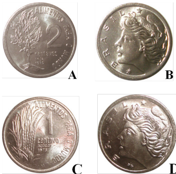
Figura 5. A e B. Moeda de 2 centavos – A) Anverso: Ramos de feijão e soja. B) Reverso. C e D: moeda de 1 centavo – C) Anverso: Cana-de-açúcar. D) Reverso.