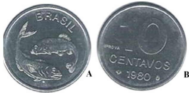
Figura 4. Moeda de 10 centavos – A) Anverso: peixes. B) Reverso.