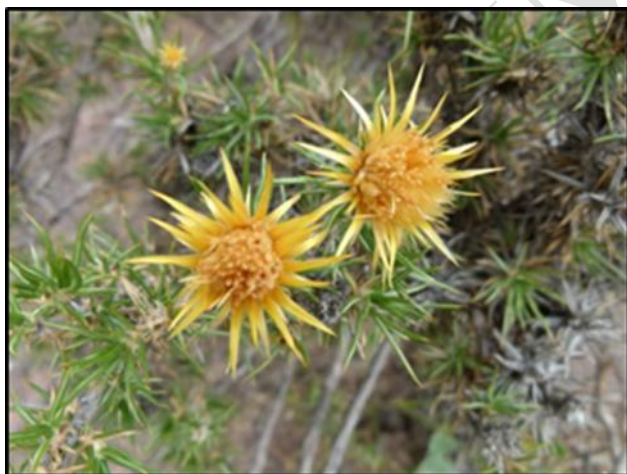
Fig 1. Fotografía de Chuquiragua erinacea D. Don (Tomadas de: https://sib.gob.ar/especies/chuquiraga-erinacea )

“En una oportunidad regresé de La Pampa con un brote de una planta que en aquella zona denominaban chilladora por el chasquido constante que producían cuando se prendían fuego. Es una chilladora sentenciaban los lugareños. Era un arbusto pinchudo, de hojas pequeñas y una flor bonita en los tonos del amarillo y el ocre. Fui a rectorado y pedí hablar con el rector –destacado botánico- a la secretaria. Volvió al momento informando que estaba en una reunión y que si me parecía le transmitiera el asunto de la consulta. Saqué el sobre con el brote y dije simplemente: Quisiera saber cómo se llama esta planta que le dicen chilladora. La secretaria quedó sorprendida por el tenor de la consulta, pero fue al lugar de reunión volviendo al rato con una sonrisa y un papel en el que se leía: Chuquiragua erinacea (Fig. 1). Después descubrí que había muchas chuquiragas distintas, con morfología y flores particulares. En épocas de internet es más fácil buscar si se sabe qué se busca o si se anima a dar rienda suelta a la curiosidad”. (Donolo, 2019: 229).