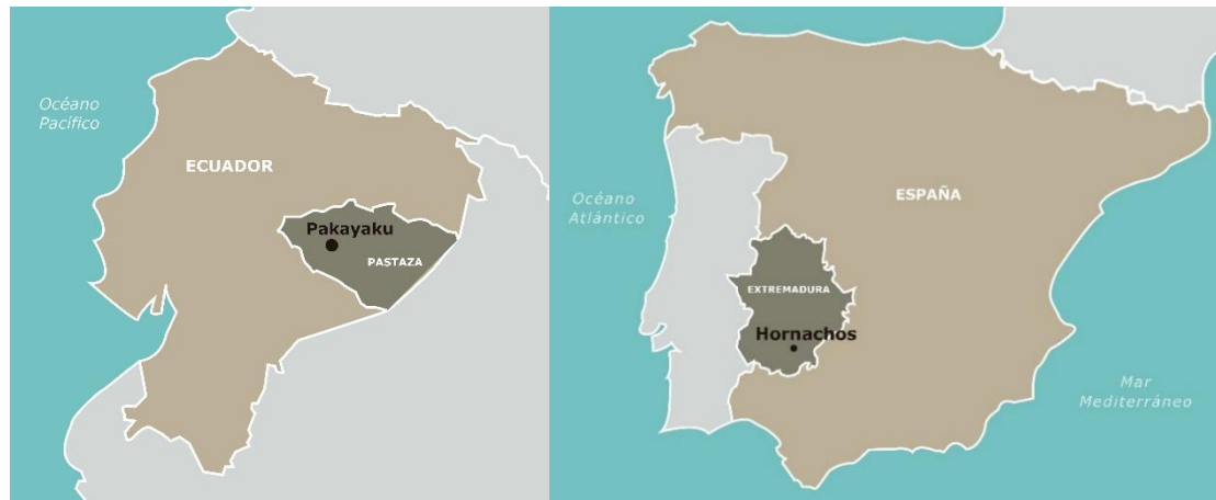
Figura 1. Localización de la comunidad Kichwa estudiada en la provincia de Pastaza en Ecuador (imagen izquierda) y de la localidad de Hornachos en España (imagen derecha).

ecológico y cultura, en las estribaciones del área protegida “Sierra Grande de Hornachos” (Figura 1).