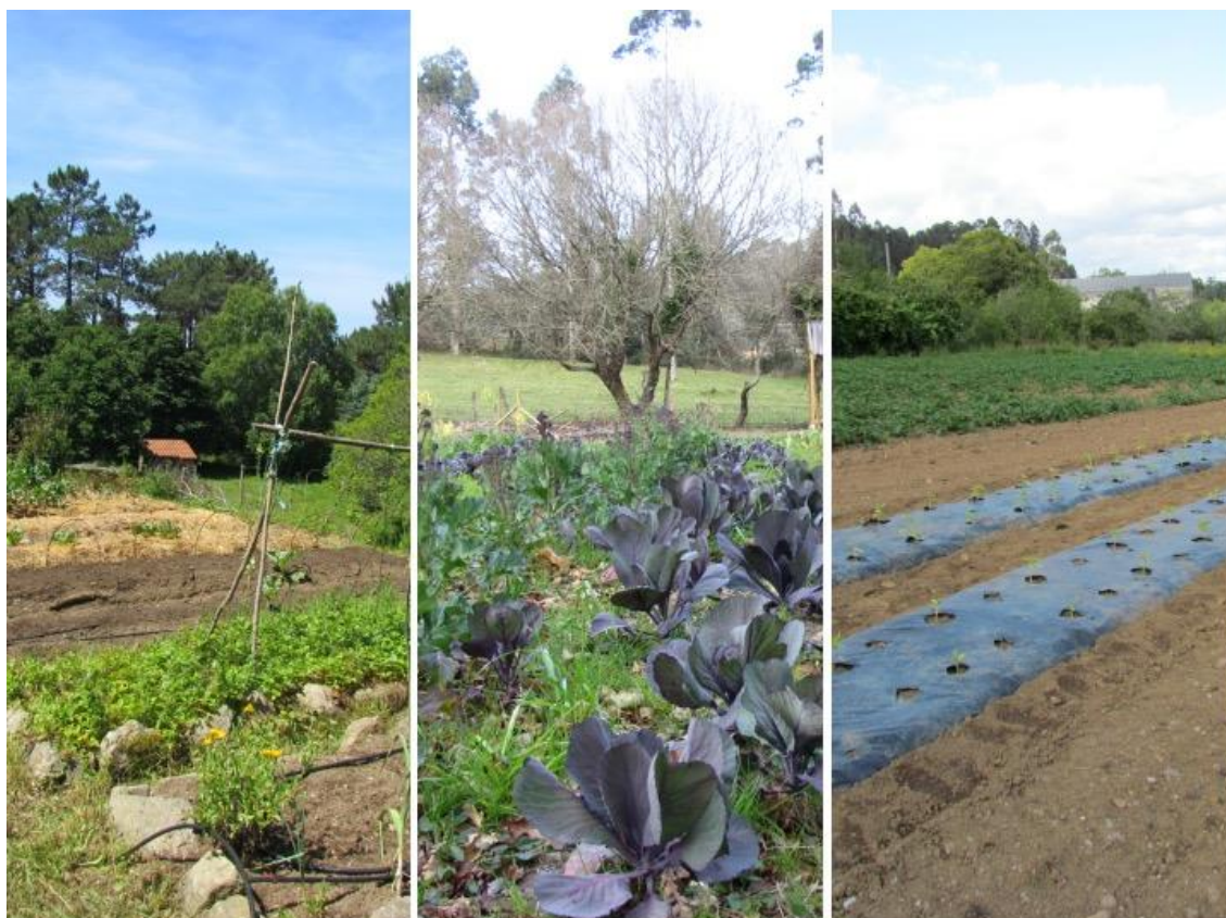
Exemplos de fincas de produtoras/es que proven iniciativas analizadas, situadas respectivamente en contextos rurais costeiros e do interior, ou en zonas rurais periurbanas de áreas metropolitanas. Esquerda: Xestas (Porto do Son). Centro: Roupar (Xermade). Dereita: Santa Marta de Babío (Bergondo).

Cómpre salientar a evolución experimentada nas iniciativas presentes nalgunhas zonas concretas, que deron lugar a modelos distintos, reproducíronse en novos colectivos ou foron mudando de modelo para adaptarse ás circunstancias das persoas que as integran.