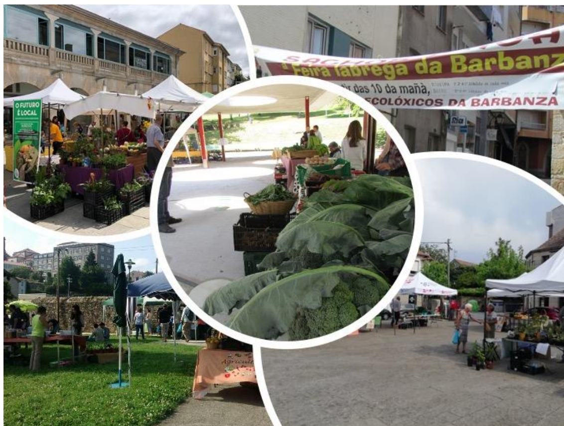
Figura 3. Feiras, mercados e encontros de consumo responsable.

Arriba-esquerda: mercado 4Ponlas (Pontevedra); fotografía: https://www.facebook.com/4ponlas/ (2018). Arriba-dereita: faixa na feira labrega organizada polos Foros Ecolóxicos da Barbanza (Ribeira); fotografía: KM. Bisquert (2019). Abaixo-esquerda: mercado agroecolóxico Entre Lusco e Fusco (Santiago de Compostela); fotografía: https://www.facebook.com/mercadoentreluscoefusco (2018). Abaixo-dereita: encontro agroalimentario de produtoras e consumidoras organizado pola Asociación O Toxo (Gondomar); fotografía: https://www.facebook.com/asoc.otoxo (2019). Centro: Mercado de Alimento Labrego (Teo); fotografía: K.M. Bisquert (2019).