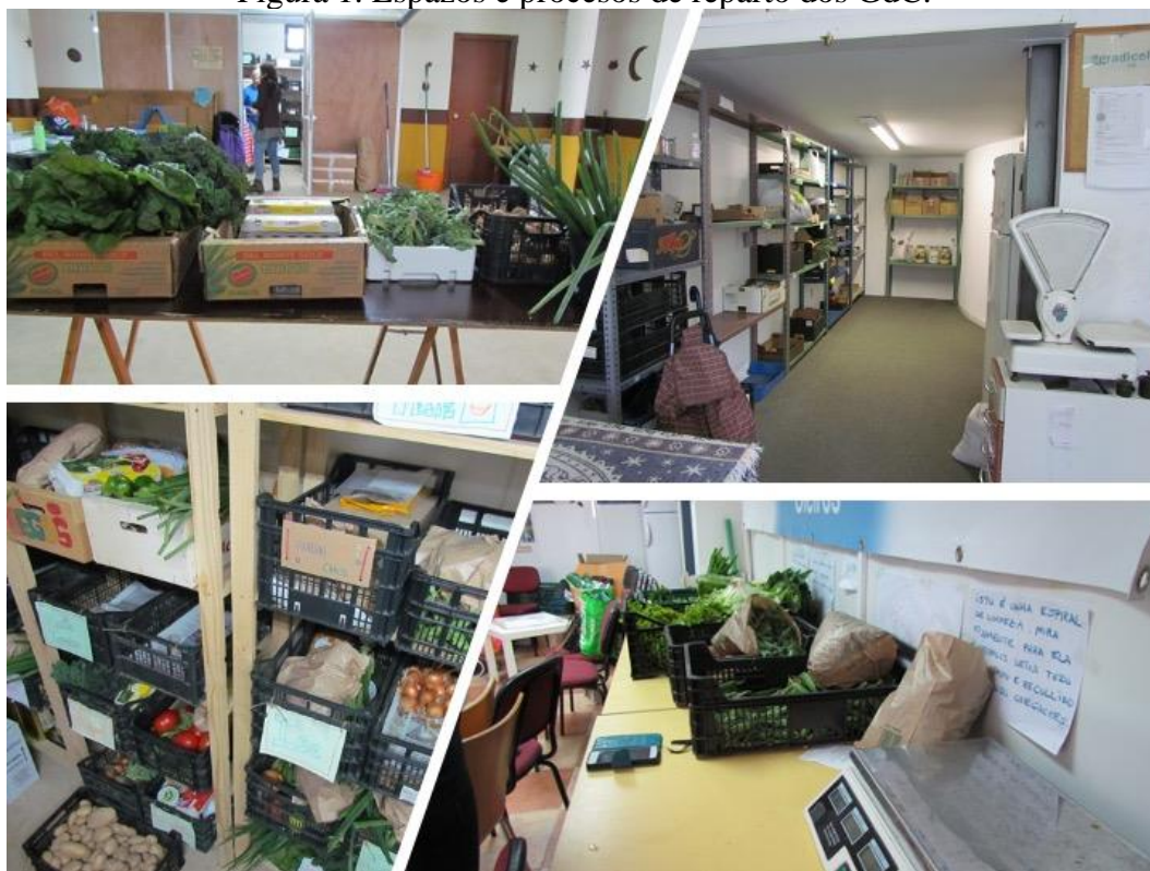
Figura 1. Espazos e procesos de reparto dos GdC.

Esquerda: reparto no GdC Eco_Lóxico (Ponte Caldelas). Arriba-dereita: local do GdC A Gradicela (Pontevedra). Abaixo-dereita: reparto no GdC Millo Miúdo (Oleiros).