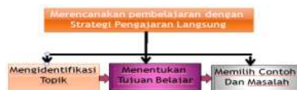
Gambar 1. Perencanaan Pembelajaran Langsung