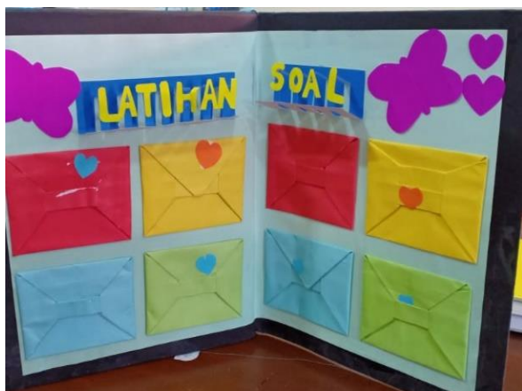
Gambar 4. Media pop-up book halaman 4

Setelah pelatihan, para guru diminta untuk mengisi post test. Pada tabel 2 dapat dilihat hasil postes para guru.