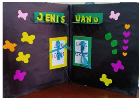
Gambar 2. Media pop-up book halaman 2